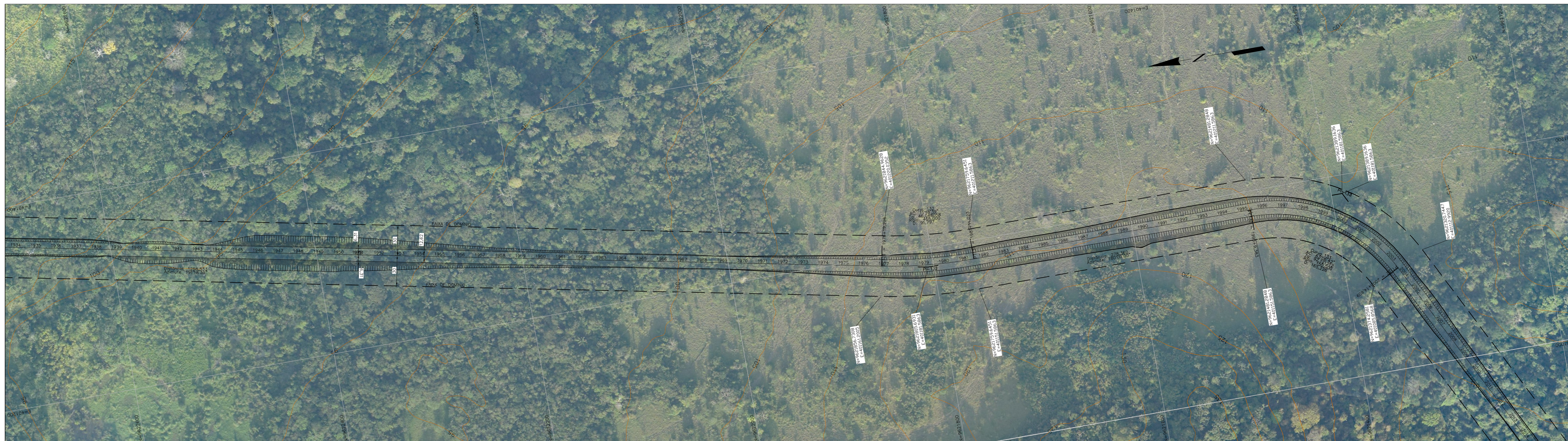
PLANTA ESCALA 1:2000