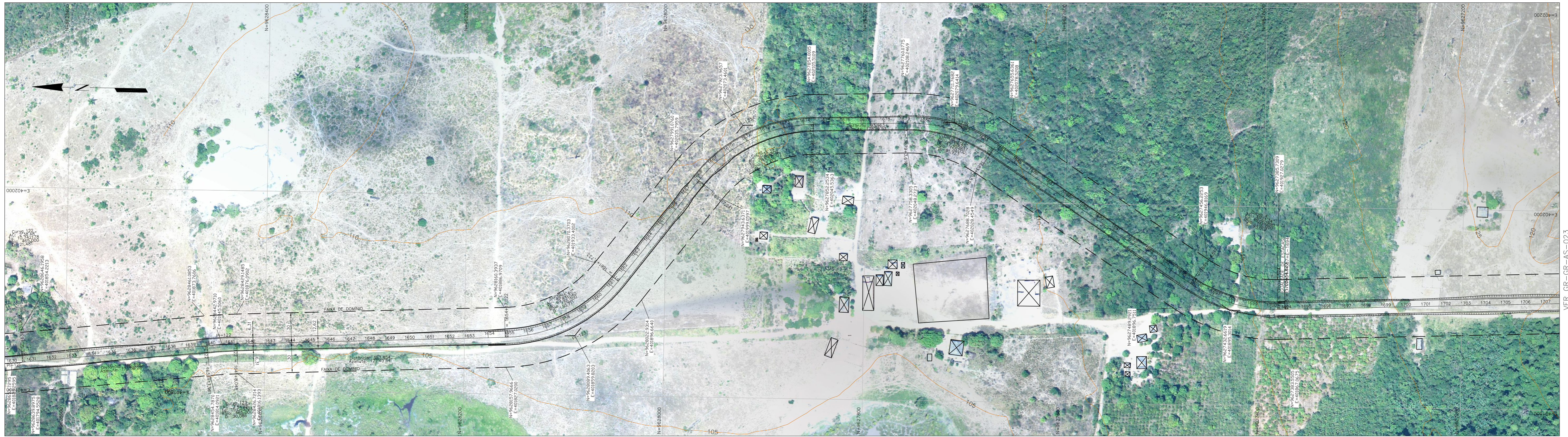
PLANTA ESCALA 1:2000