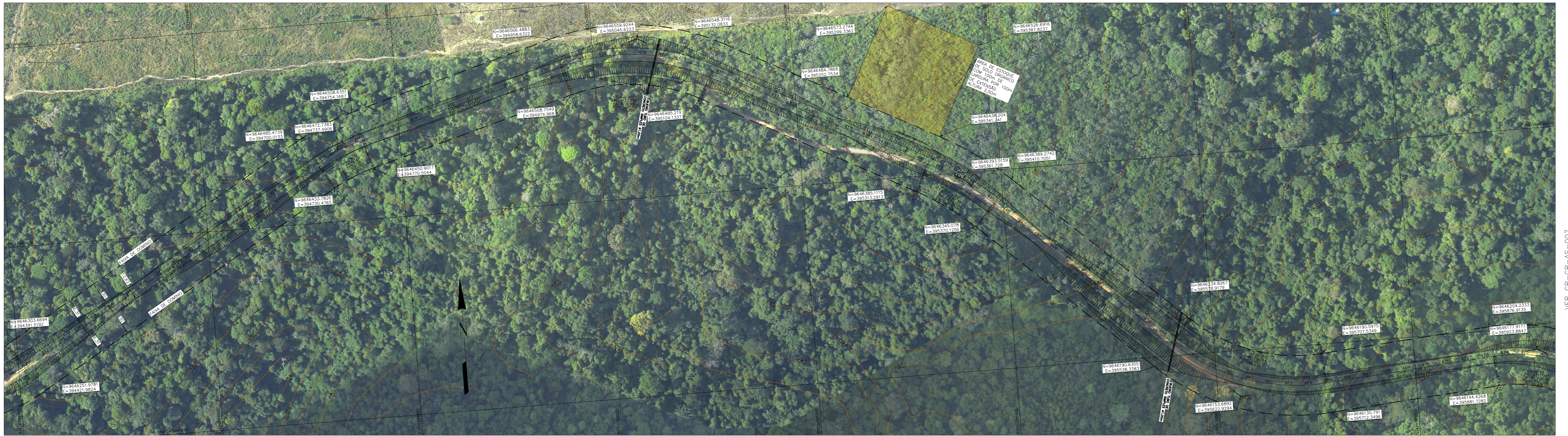
PLANTA ESCALA 1:2000