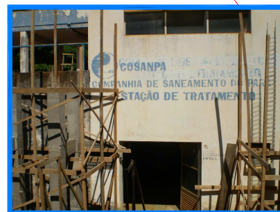
VISTA DO PRÉDIO ADMINISTRATIVO