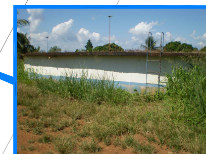
VISTA DO RESERVATÓRIO APOIADO