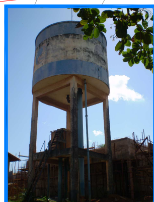
VISTA DO RESERVATÓRIO ELEVADO