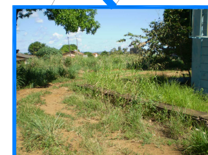
DETALHE DA FALTA DE MANUTENÇÃO