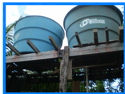
RESERVATÓRIO 2 - ELEVADO 2x3m 3