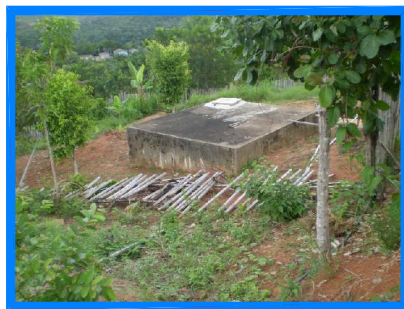
RESERVATÓRIO 1 - APOIADO 22m 3