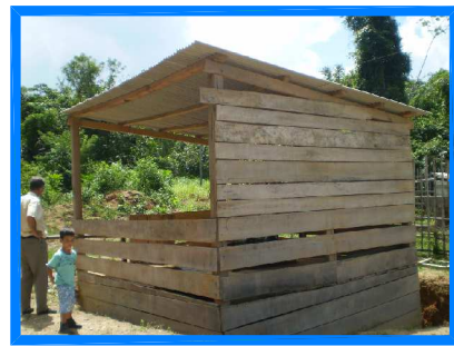
POÇO RASO PROFUNDIDADE 5,0m