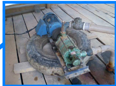
SISTEMA DE BOMBAMENTO DO POÇO