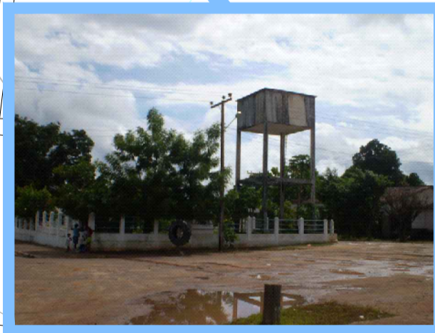
RESERVATÓRIO ELEVADO, 36m 3 E POÇO RASO