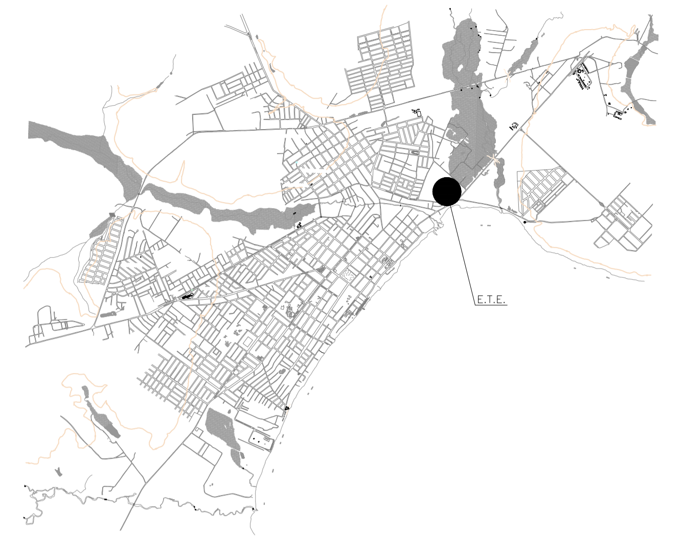
PLANTA DE LOCAÇÃO