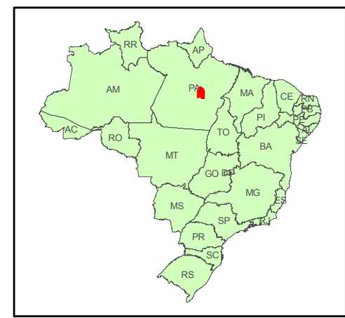
Localização da Área de Interesse