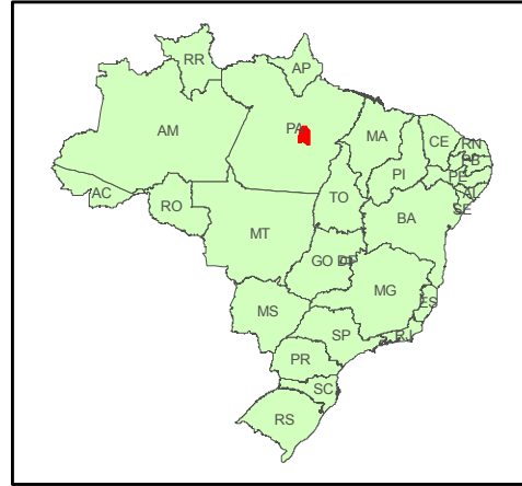
Localização da Área de Interesse