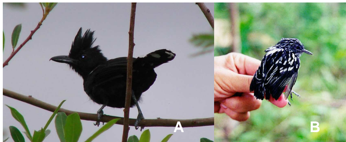
Figura 3. (A) choca-d'água ( Sakesphorus luctuosus , macho) e (B) choquinha-estriada ( Myrmotherula multistriata ), espécies restritas aos habitats ribeirinhos.