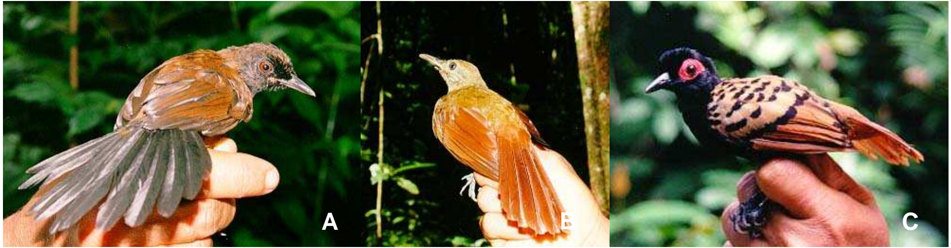
Figura 1. (A) Olho-de-fogo selado ( Pyriglena leuconota similis , fêmea), (B) arapaçu-da-taoca ( Dendrocincla merula castanoptera ) e (C) mãe-de-taoca-pintada ( Phlegopsis nigromaculata bowmani ), subespécies registradas somente na margem esquerda do rio Xingu.