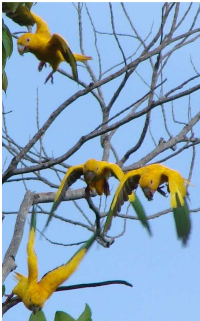
Figura 4. Ararajubu ( Guarouba guarouba ), espécie de ave altamente ameaçada de extinção por uma combinação de fatores que incluem perda de hábitat, caça e comércio ilegal de animais silvestres.