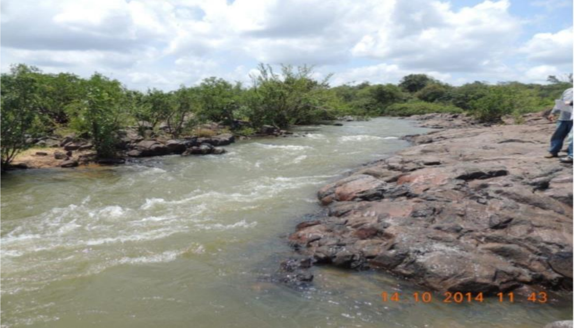
Região da foz do rio Bacajá com detalhe do canal na região da cachoeira Percata.