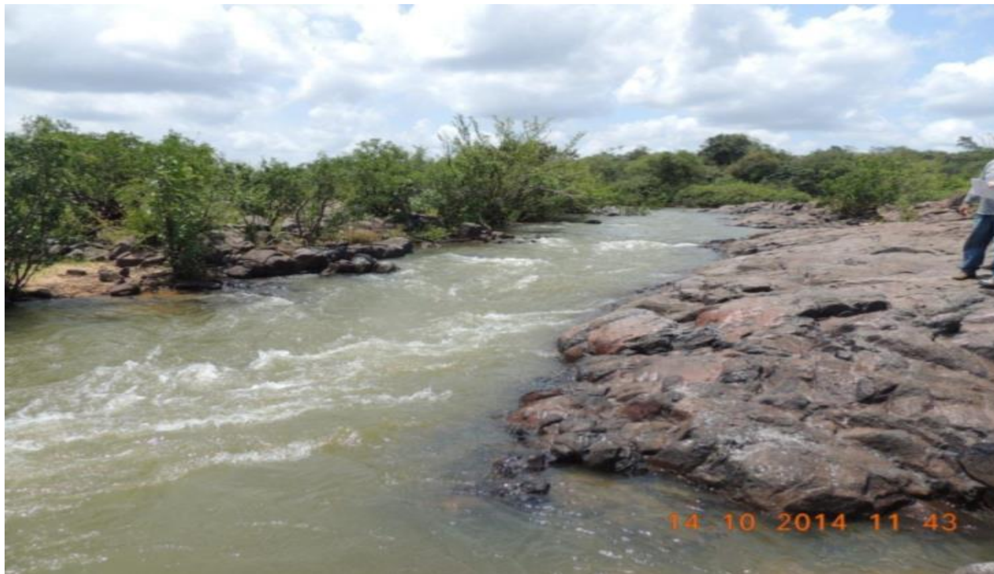
Região da foz do rio Bacajá com detalhe do canal na região da cachoeira Percata.