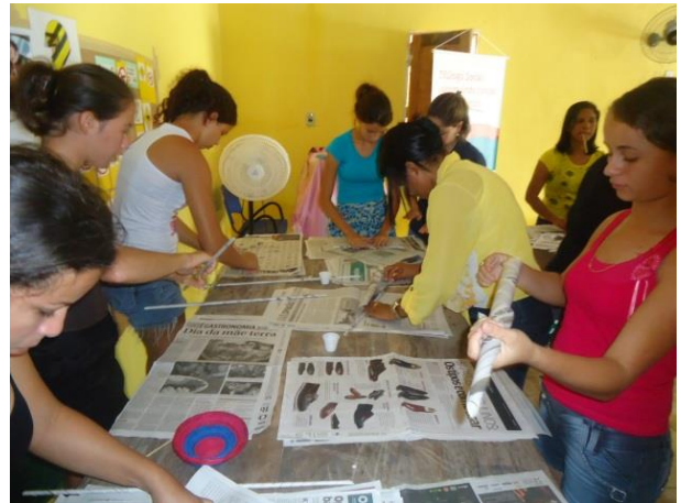
Foto 13-12: Confeção dos canudos de jornal. Vila Pindaré (Presa de Porco). Locação 21-22. Buriticupu/MA.