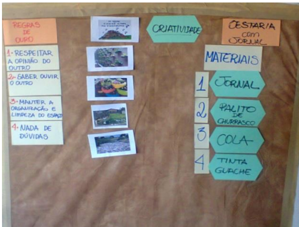
Foto 13-17: Mural exposto com figuras ilustrativas, regras de ouro e materiais utilizados. Vila Ildemar. Locação 33-34 - Açailândia/MA