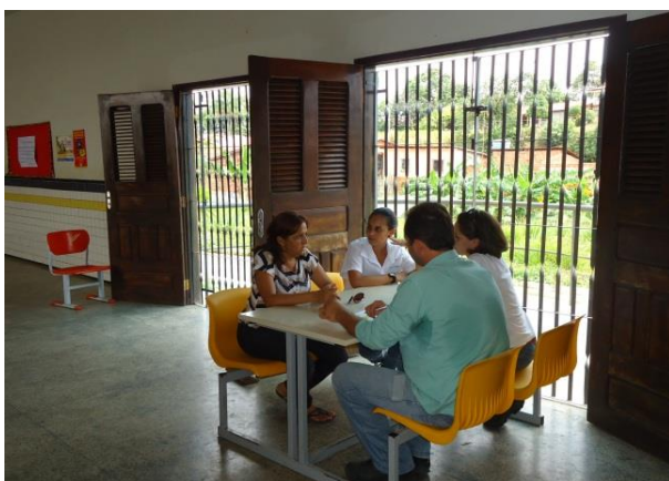
Foto 13-1: Mobilização e agendamento Blitz na U.E.B. Evandro Bessa, em Estiva.

O registro fotográfico abaixo exemplifica algumas das atividades desenvolvidas, referentes ao Programa de Educação Ambiental.