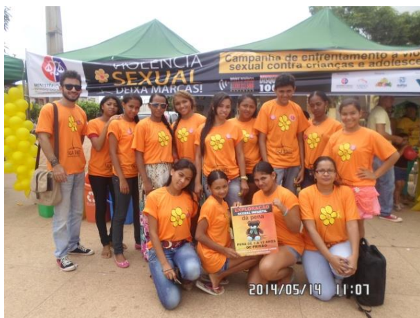
Foto 13-31: Equipe do PESS na manhã de atividades, em Buriticupu. Buriticupu.