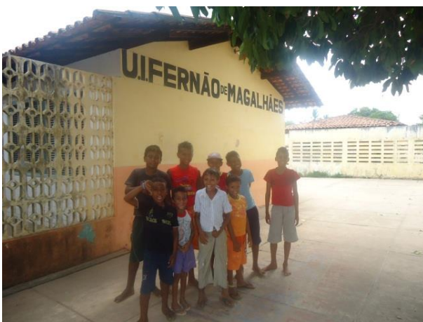
Foto 13-9: Crianças presentes no local. Comunidade de Vila Samara. Locação 02 – São Luís/MA