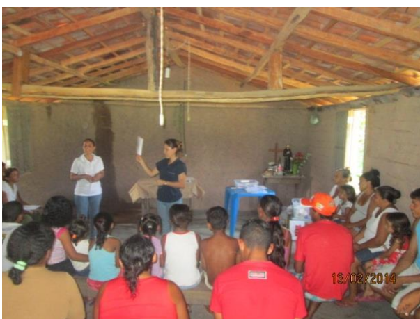
Foto 13-15: Diálogo inicial sobre educação ambiental, sobre o PEA e a questão dos resíduos. La Bote. Locação 20-21 - Buriticupu/MA.