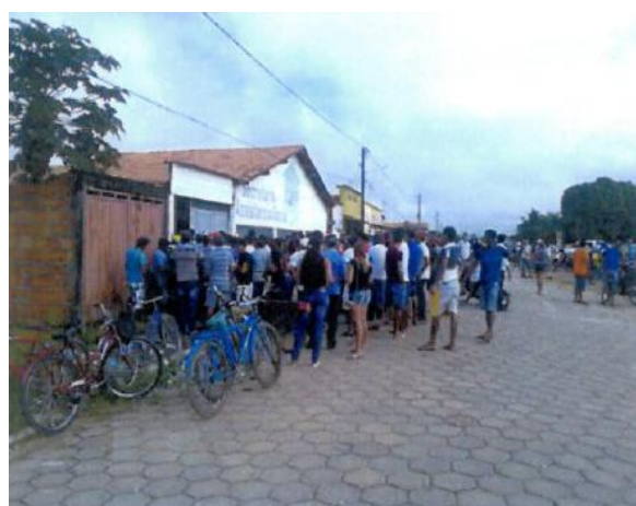
Foto 13-28: Cadastramento de Profissionais - Bom Jesus das Selvas/MA