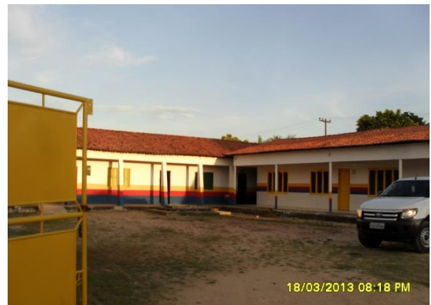
Foto 13-26: Escola onde aconteceu a atividade. Sede de Tufilândia Locação 14-15.