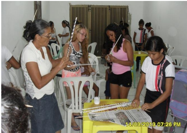
Foto 13-23: Montagem das cestas. Olho D'água dos Carneiros. Pindaré Mirim/MA - Locação 13-14