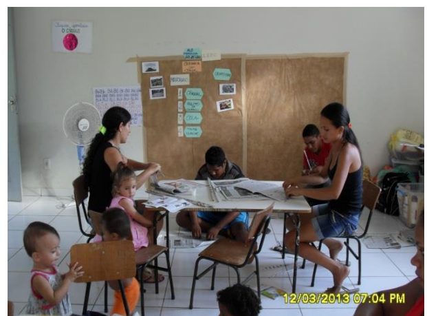
Foto 13-22: Moradores produzindo as cestas de jornal. Pequizeiro. Locação 13-14. Santa Inês.