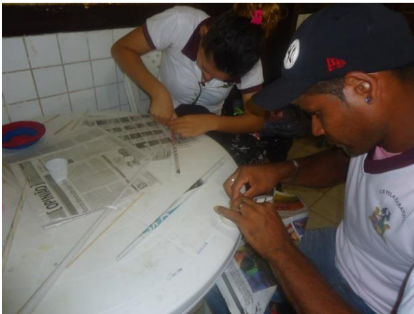
Foto 13-7: Produção da etapa do caracol, com o jornal. Comunidade de Vila Maranhão. Locação 02 – São Luís /MA.