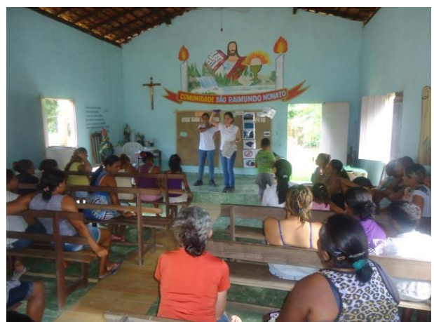
Foto 13-16: Comunidade de Nova Vida Abordagem inicial sobre os resíduos sólidos e o PEA. Bom Jesus das Selvas/MA. Locação 23-24.