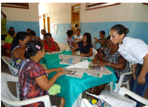
Foto 13-3: Produção das cestas pelo público participante. Comunidade de Pedrinhas. Locação 02 – São Luís /MA.