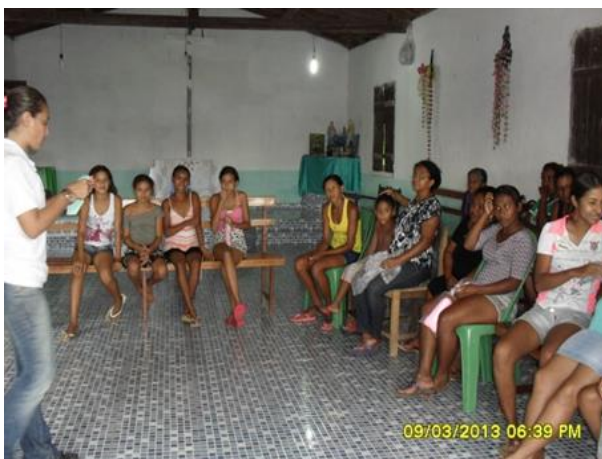
Foto 13-19: Abordagem inicial sobre questões ambientais e geração e destinação de lixo. Puraqueú. Locação 11-12. Igarapé do Meio/MA.