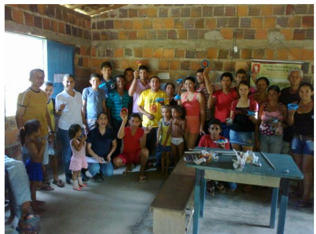
Foto 13-14: Todos participantes reunidos ao final da atividade. Vila dos Farias. Locação 20-21. Buriticupu/MA