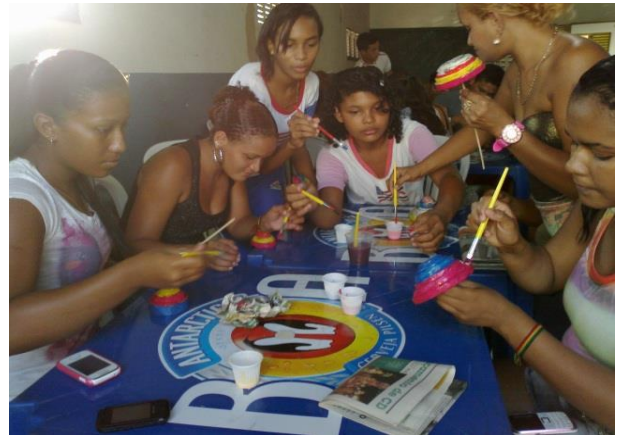
Foto 13-6: Grupo de mulheres na etapa final de produção das cestas, a pintura. Comunidade de Estiva. Locação 02 – São Luís /MA