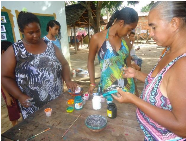
Foto 13-11: Acabamento da cestaria com a pintura. Vila Concórdia. Locação 21-22. Buriticupu/MA.