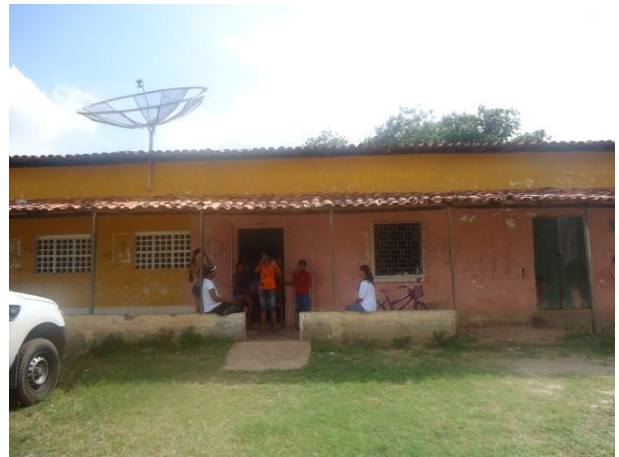
Foto 13-8: Local onde seria realizada a atividade e público presente. Comunidades de Coqueiro e Vila Jussara. Locação 02 – São Luís /MA.