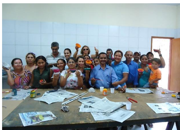
Foto 13-4: Equipe reunida ao final. Cada um com o seu produto em mãos. Comunidade de Rio Grande. Locação 02 – São Luís /MA.