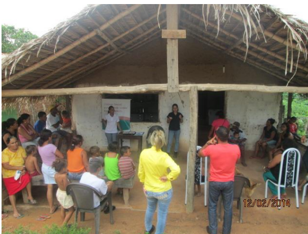
Foto 13-13: Equipe de implantação do PEA dialogando com a comunidade a respeito do reagendamento da atividade. Buriticupu/MA Presinha. Locação 20-21.