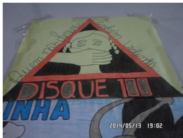
Foto 13-30: Cartazes produzidos pelos jovens do PESS. Vila Pindaré