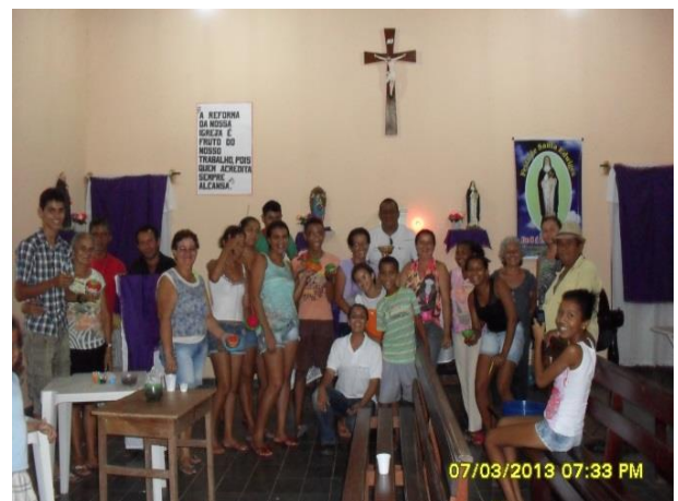
Foto 13-20: Todos os participantes reunidos ao final segurando suas cestas prontas. Barradiço Locação 13-14. Santa Inês/MA.