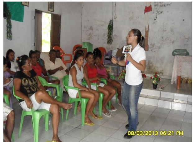
Foto 13-18: Abordagem inicial sobre a questão dos resíduos. Igarapé do Meio Vila Riachão Locação 11-12