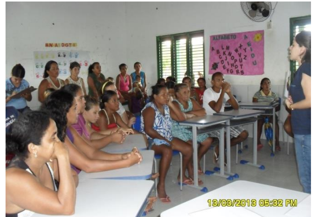
Foto 13-24: Abordagem inicial sobre a questão do lixo. Locação 14-15. Tufilândia Serra (Serrinha)