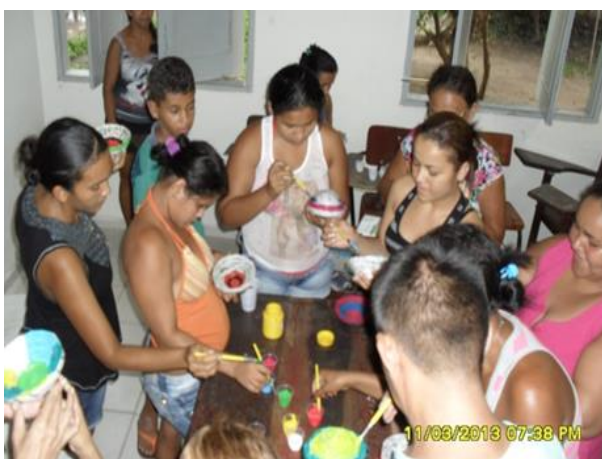
Foto 13-21: Momento da pintura dos artesanatos. Encruzilhada Locação 13-14. Santa Inês/MA.