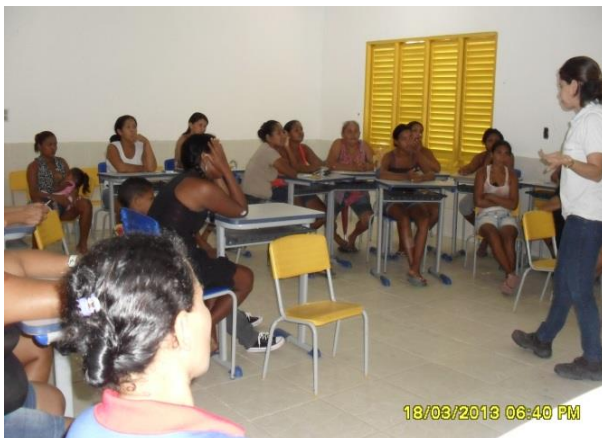
Foto 13-25: Abordagem inicial sobre a questão do lixo. Sede de Tufilândia Locação 14-15.