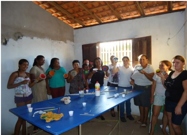
Foto 13-5: Equipe reunida ao final. Cada um com o seu produto em mãos. Comunidade de Ananandiba. Locação 02 – São Luís /MA