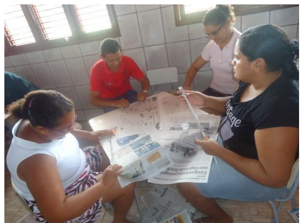
Foto 13-10: Confecção das cestas de jornal. Buriticupu/MA Vila União. Locação 21-22.