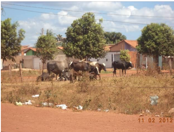
Foto 19: Animais circulando soltos pelas vias da Vila João Paulo II, em Açailândia - MA.