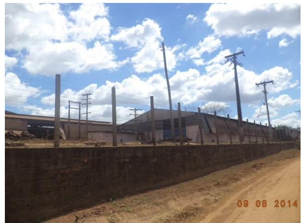
Foto 76: Indústria Verneer-line, situada na via de Acesso AC03, Açailândia - MA.