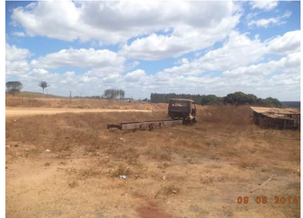
Foto 58: Sucata abandonada próximo da via de Acesso AC02, Açailândia - MA.