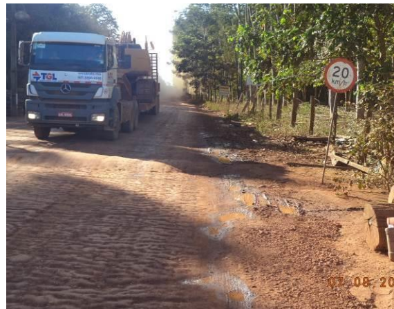
Foto 38: Veículo pesado trafegando na via de acesso AC01A, Açailândia - MA.