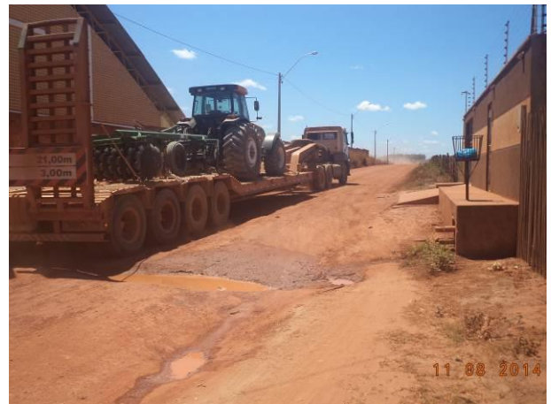
Foto 80: Tráfego de veículos pesados na via de Acesso AC04A, Açailândia - MA.