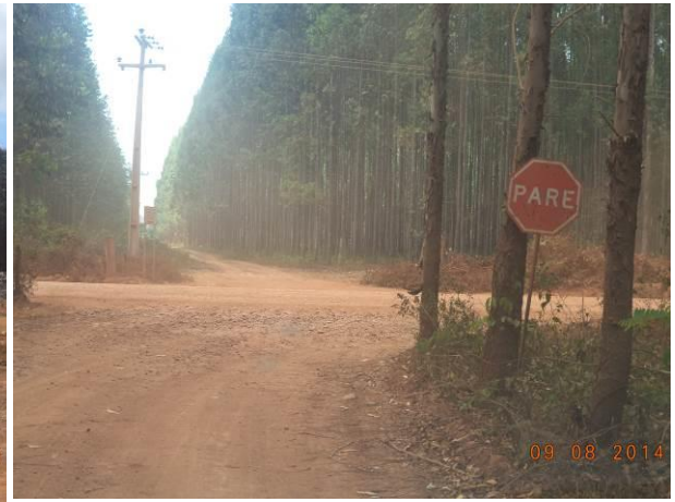
Foto 46: Presença de cruzamento no Acesso AC01B, Açailândia - MA.