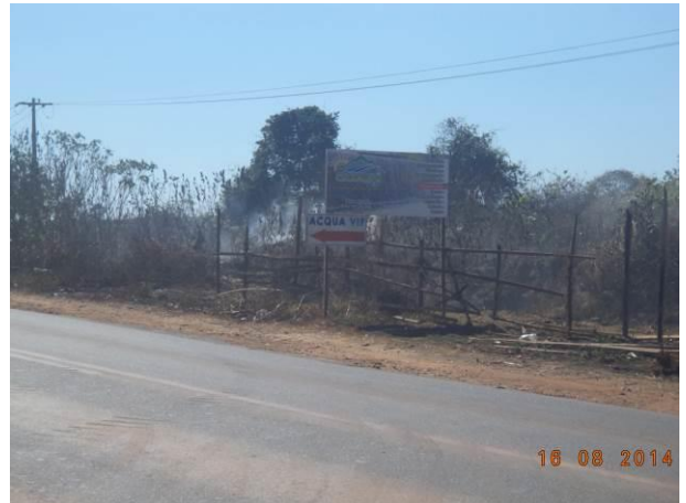
Foto 66: Realização de queimadas na via de Acesso AC02.1, Açailândia - MA.