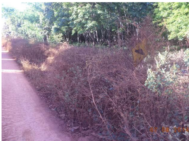
Foto 39: Sinalização vertical coberta pela vegetação na via de Acesso AC01A, Açailândia - MA.