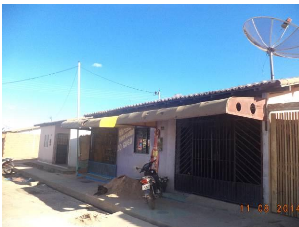
Foto 27: Estabelecimentos comerciais da Vila Juscelino, em Açailândia - MA.