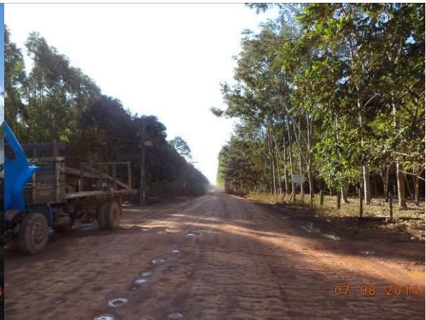
Foto 6: Condições de pavimentação na localidade Vila Reta(Quatro Bocas), em Açailândia - MA.