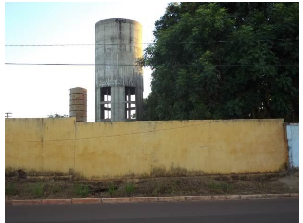
Foto 32: Caixa d'água para o abastecimento da Vila Ildemar, em Açailândia - MA.