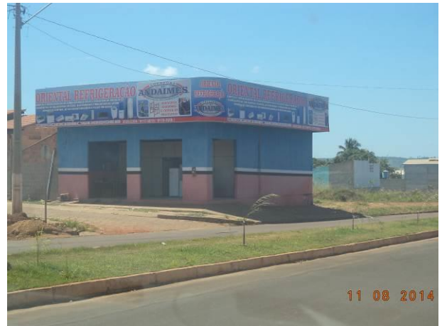
Foto 90: Estabelecimento comercial ao longo da via de Acesso AC04B, Açailândia - MA.