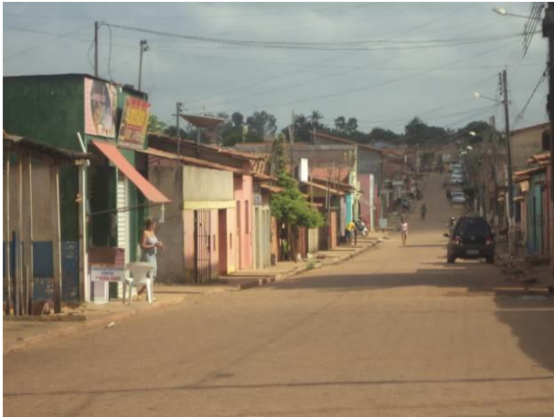
Foto 33: Condições de pavimentação da Vila Ildemar, em Açailândia - MA.