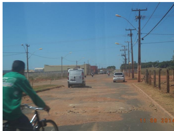
Foto 14: Tráfego de veículos na Avenida Alexandre Costa, localidade Residencial Tropical, em Açailândia - MA.