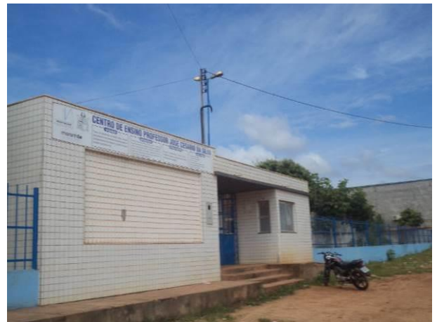
Foto 24: Escola Estadual Centro de Ensino José Cesário da Silva, localizada na Vila João Paulo II, em Açailândia - MA.