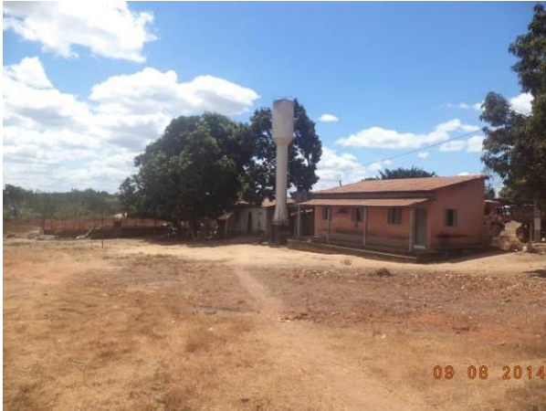
Foto 57: Habitação localizada às margens da via de Acesso AC02, Açailândia - MA.