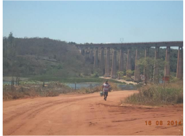
Foto 70: Morador trafegando ao longo do Acesso AC02.2, Açailândia - MA.