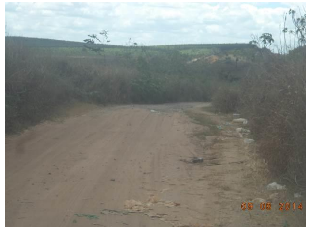
Foto 60: Resíduos sólidos espalhados a céu aberto e condições da pavimentação da via de acesso AC02, Açailândia - MA.