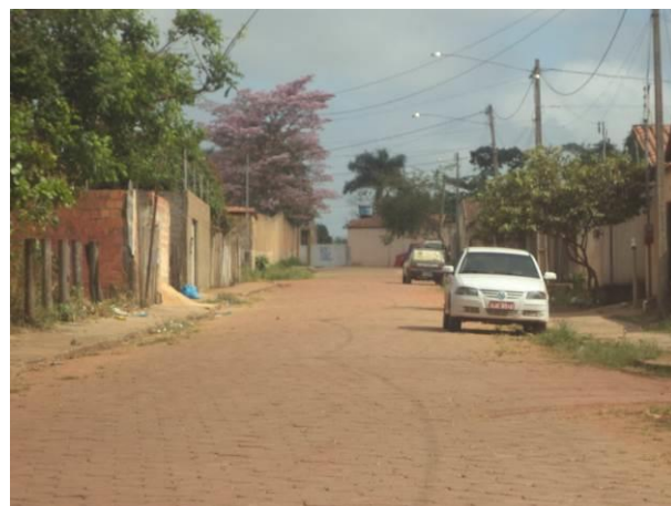
Foto 16: Pavimentação de via, localidade Residencial Tropical, em Açailândia - MA.