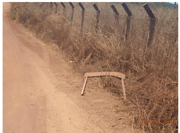
Foto 68: Sinalização caída na via de Acesso AC02.2, Açailândia - MA.