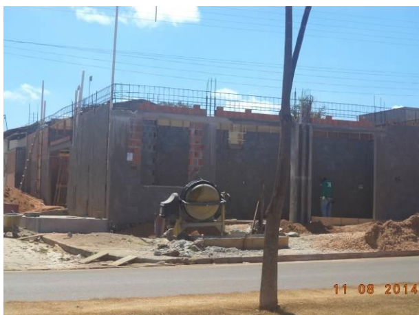
Foto 87: Construção ao longo da via de Acesso AC04B, Açailândia - MA.