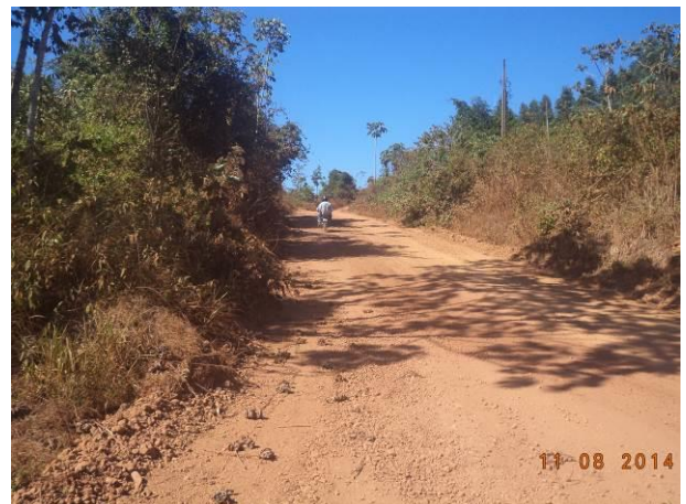
Foto 92: Tráfego de moradores ao longo do Acesso AC07, Açailândia - MA.