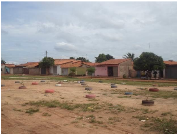
Foto 21: Residências existentes na Vila João Paulo II, em Açailândia - MA.