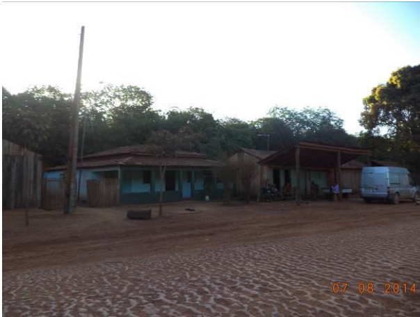
Foto 9: Condições de pavimentação na localidade Seringal, em Açailândia - MA.