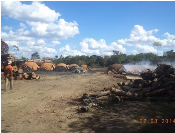
Foto 5: Carvoaria existente na localidade Vila Reta (Quatro Bocas), em Açailândia - MA.