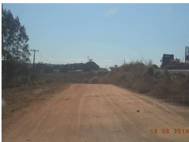
Foto 63: Condições de pavimentação do Acesso AC02.1, Açailândia - MA.