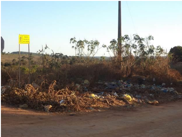
Foto 35: Resíduos sólidos lançados a céu aberto, na Vila Ildemar, em Açailândia - MA.