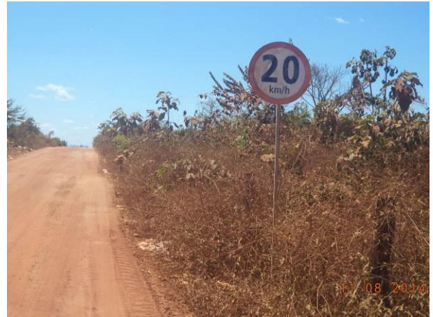
Foto 82: Presença de sinalização na via de Acesso AC04A, Açailândia - MA.