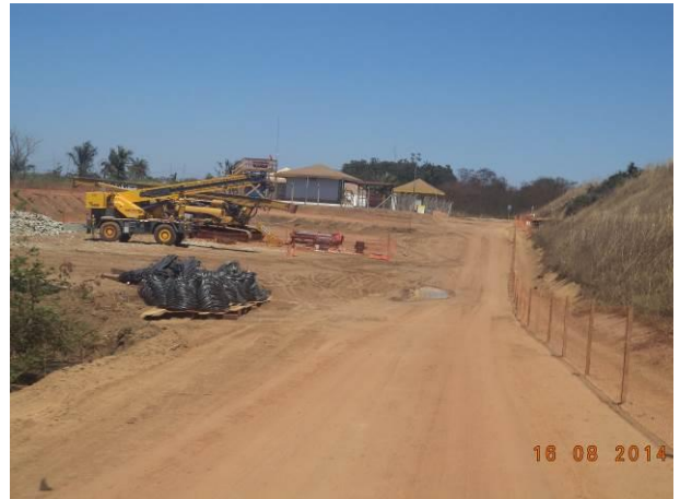
Foto 72: Canteiro de Obras situado no Acesso AC02.2, Açailândia - MA.