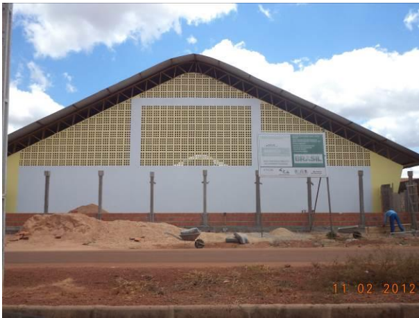
Foto 17: Construção de quadra poliesportiva coberta e com arquibancada, na localidade Residencial Tropical, em Açailândia - MA.