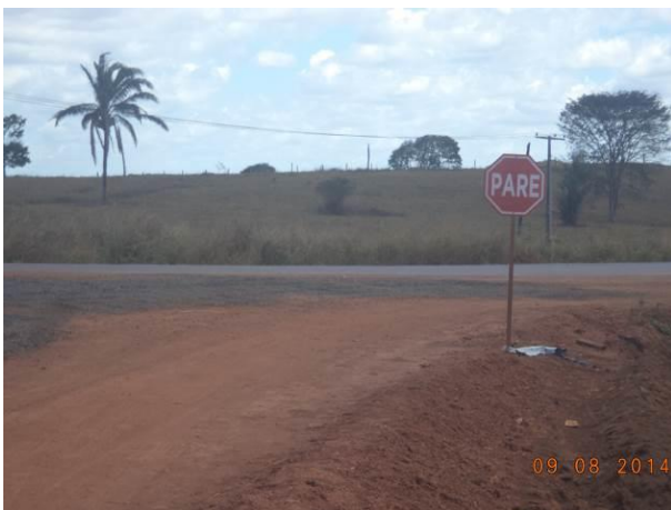
Foto 55: Presença de sinalização no Acesso Viário AC02, Açailândia - MA.