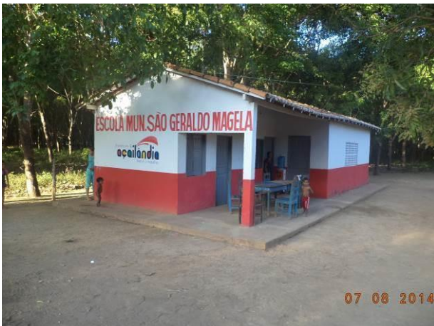
Foto 7: Escola Municipal São Geraldo Magela, situada na localidade Seringal, em Açailândia - MA.