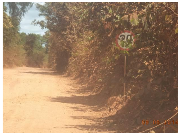
Foto 50: Sinalização coberta pela vegetação no Acesso AC01C, Açailândia - MA.