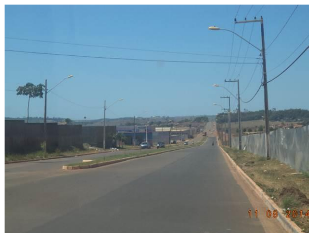
Foto 88: Iluminação pública e condição de pavimentação ao longo da via de Acesso AC04B, Açailândia - MA.