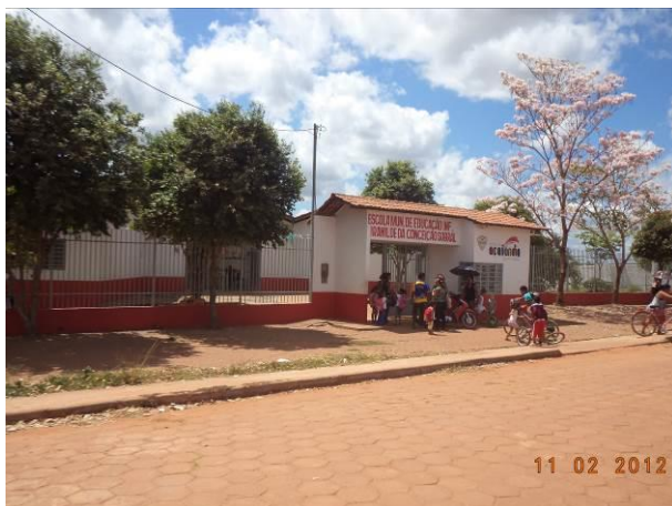
Foto 13: Escola Municipal Professora Iranilde da Conceição Sobral, situada na localidade Residencial Tropical, em Açailândia - MA.