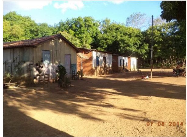
Foto 10: Padrão construtivo das residências da localidade Seringal, em Açailândia - MA.