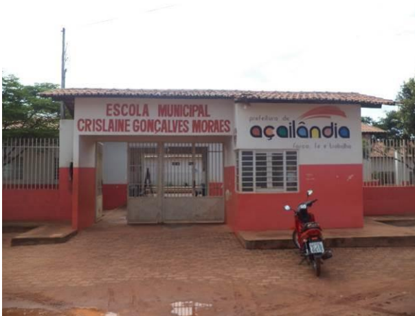
Foto 23: Escola Municipal Crislaine Gonçalves Moraes, situada na localidade João Paulo II.