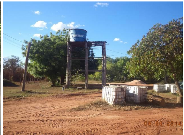
Foto 8: Caixa d'água que abastece a localidade de Seringal, em Açailândia - MA.