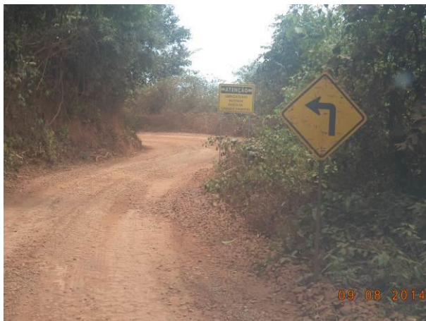
Foto 49: Presença de sinalização no Acesso Viário AC01C, Açailândia - MA.