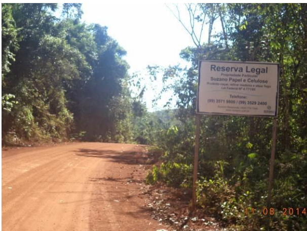
Foto 731: Reserva legal ao longo do Acesso AC07, Açailândia - MA.