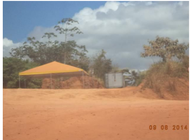
Foto 54: Canteiro de Obras existente do Acesso AC01C, Açailândia - MA.