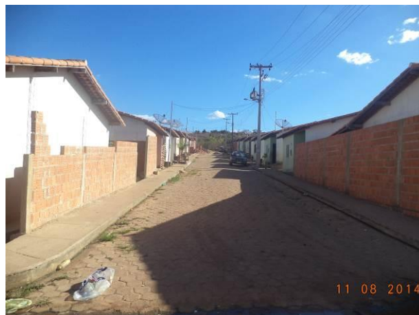
Foto 26: Iluminação pública da Vila Juscelino, em Açailândia - MA.