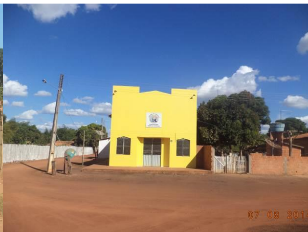
Foto 2: Igreja Assembleia de Deus, situada na localidade de Vila Reta (Quatro Bocas) em Açailândia - MA.