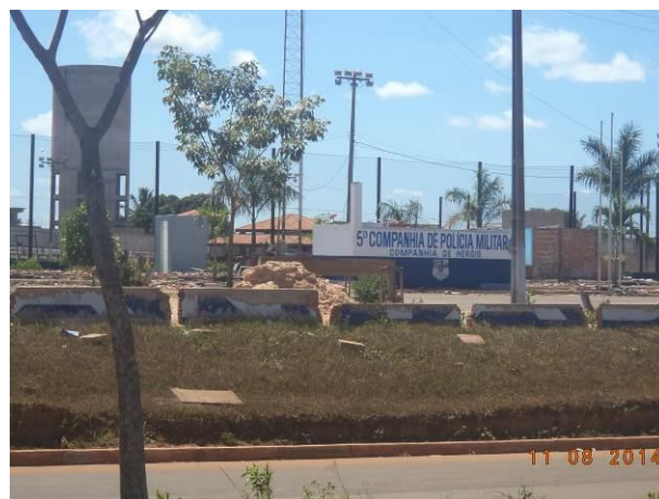
Foto 86: 9ª Companhia de Polícia Militar, situada na via de Acesso AC04B, Açailândia - MA.