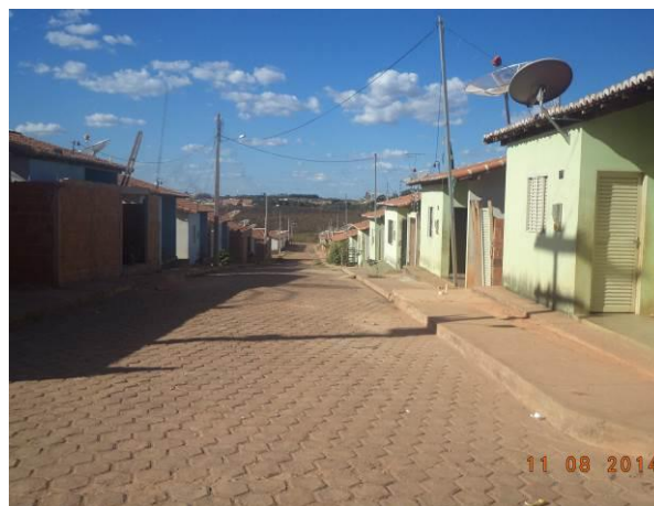
Foto 28: Condições de pavimentação da comunidade Vila Juscelino, em Açailândia - MA.