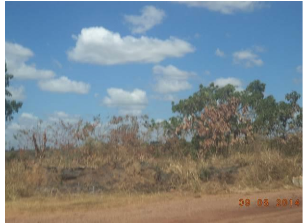
Foto 78: Ponto de queimada na via de Acesso AC03, Açailândia - MA.