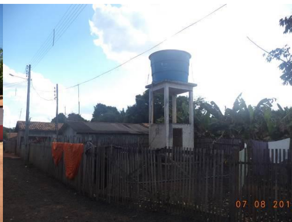
Foto 4: Caixa d'água responsável pela distribuição da água para a comunidade de Vila Reta (Quatro Bocas), em Açailândia - MA.