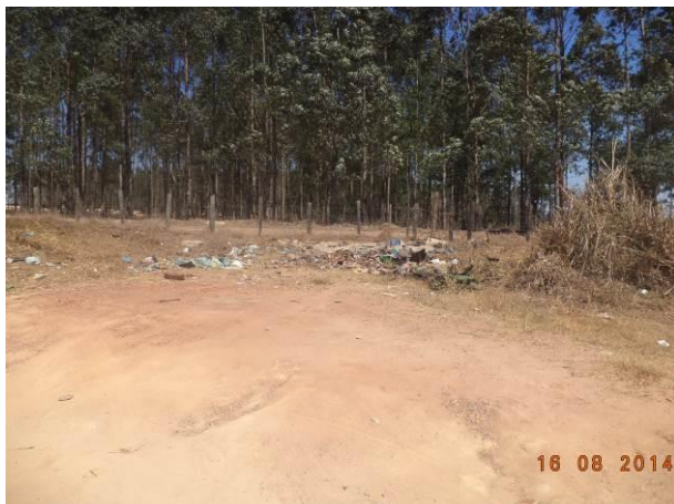
Foto 61: Resíduos sólidos lançados às margens do Acesso Viário AC02.1, Açailândia - MA.