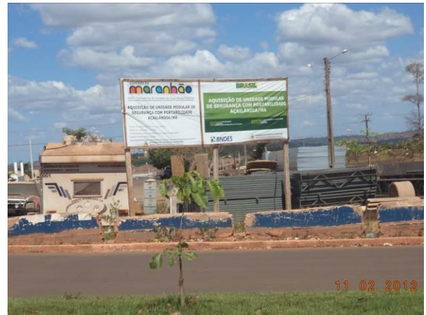
Foto 18: Aquisição de unidade modular de segurança com portabilidade na localidade Residencial Tropical, em Açailândia - MA.