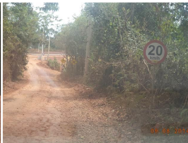
Foto 52: Condições de pavimentação e sinalização do Acesso Viário AC01C, Açailândia - MA.