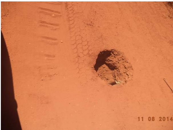
Foto 79: Condições de pavimentação da via de Acesso AC04A, Açailândia - MA.