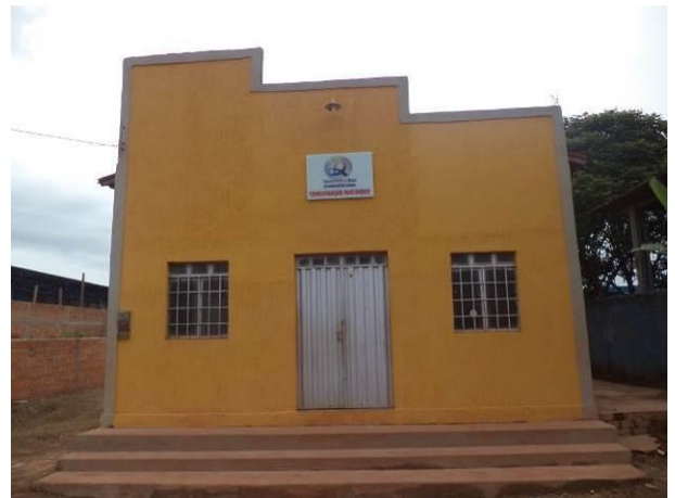
Foto 22: Igreja Assembleia de Deus localizada na Vila João Paulo II, em Açailândia - MA.