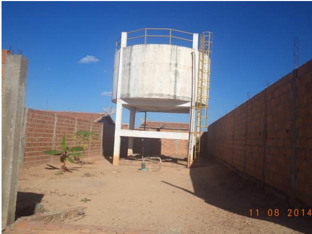
Foto 29: Caixa d'água presente na localidade Vila Juscelino, em Açailândia - MA.