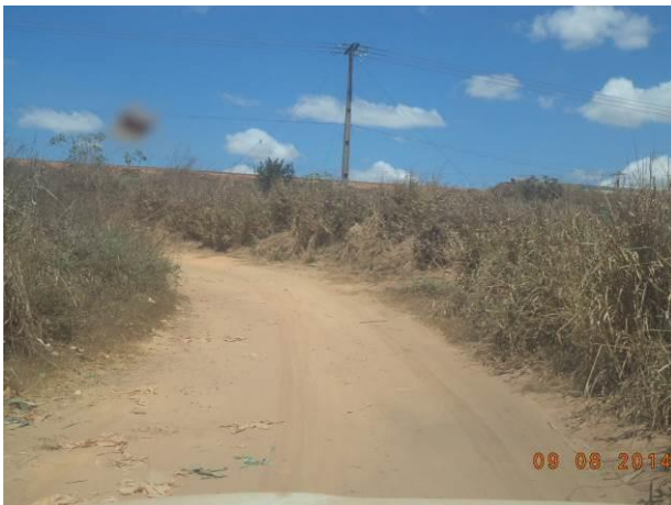
Foto 59: Trecho do Acesso AC02 com distribuição de energia elétrica, Açailândia - MA.