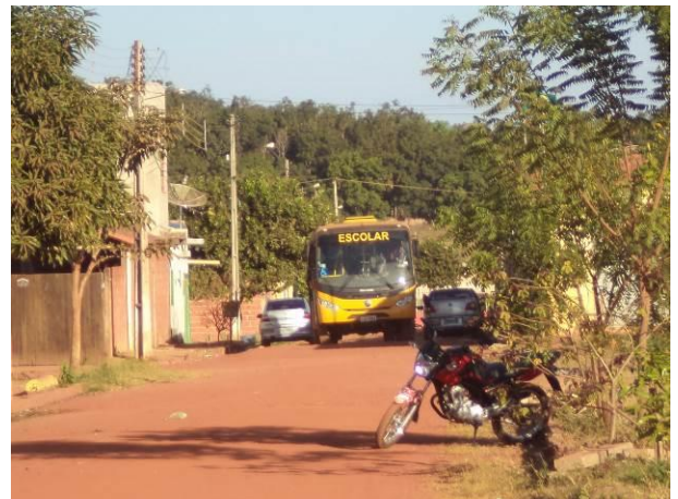
Foto 20: Condições de pavimentação das vias da Vila João Paulo II, em Açailândia - MA.