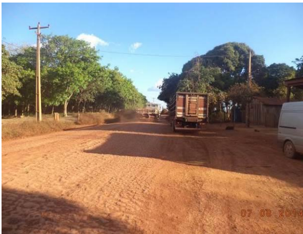
Foto 11: Tráfego de veículos pesados na localidade Seringal, em Açailândia - MA.