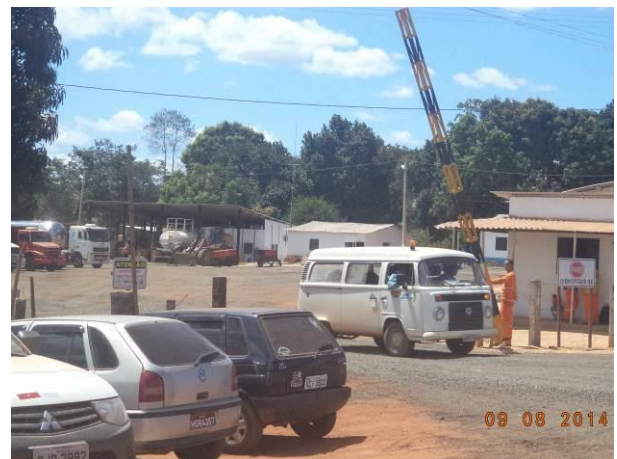
Foto 56: Entrada do Canteiro de Obras no Acesso AC02, Açailândia - MA.