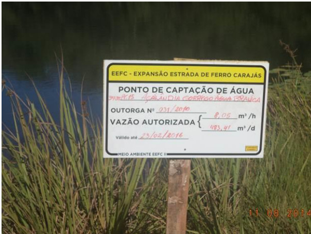
Foto 93: Ponto de captação de água de uso da EEFC situada na via de Acesso AC07, Açailândia - MA.