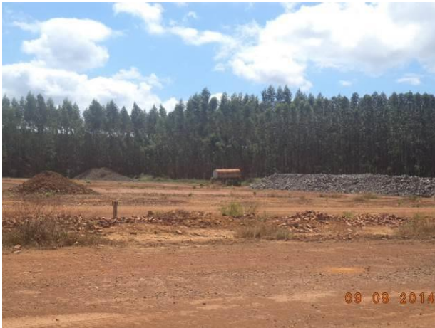
Foto 45: Materiais depositados à margem do Acesso AC01B, Açailândia - MA.