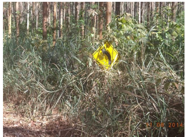
Foto 96: Sinalização coberta pela vegetação na via de Acesso AC07, Açailândia - MA.