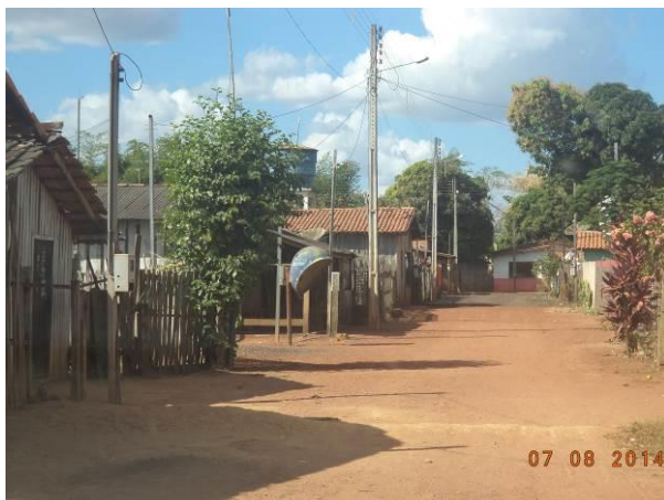
Foto 1: Padrão construtivo das residências e condições da pavimentação na Vila Reta (Quatro Bocas), em Açailândia - MA.