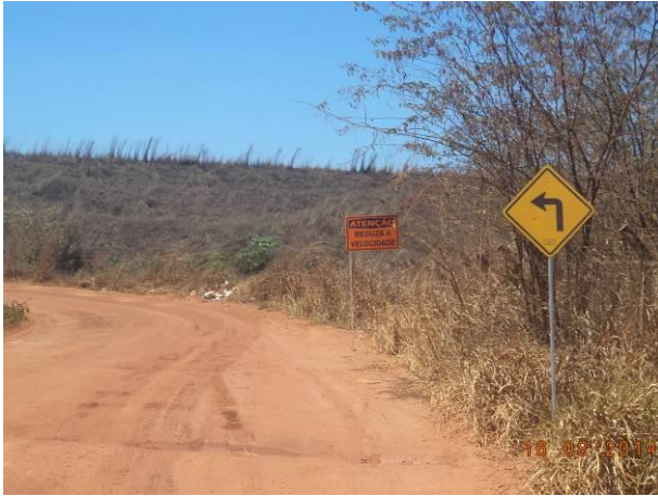
Foto 69: Condições de pavimentação e presença de sinalização no Acesso AC02.2, Açailândia - MA.