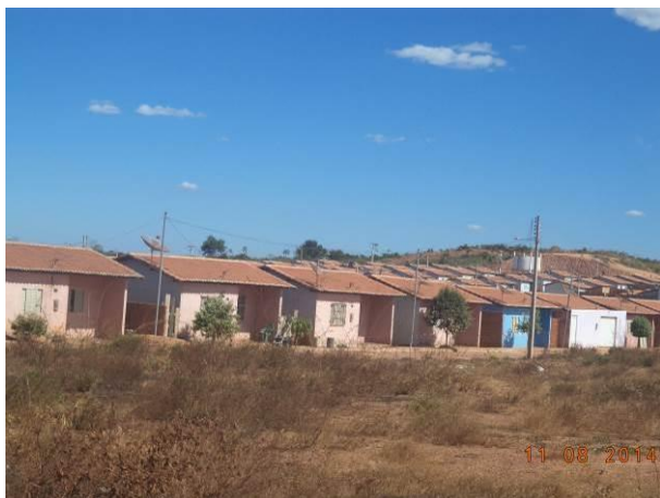
Foto 25: Residencial Vila Juscelino (Projeto Minha Casa Minha Vida), em Açailândia - MA.