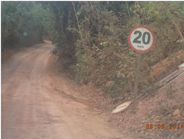
Foto 53: Sinalização caída no Acesso Viário AC01C, Açailândia - MA.