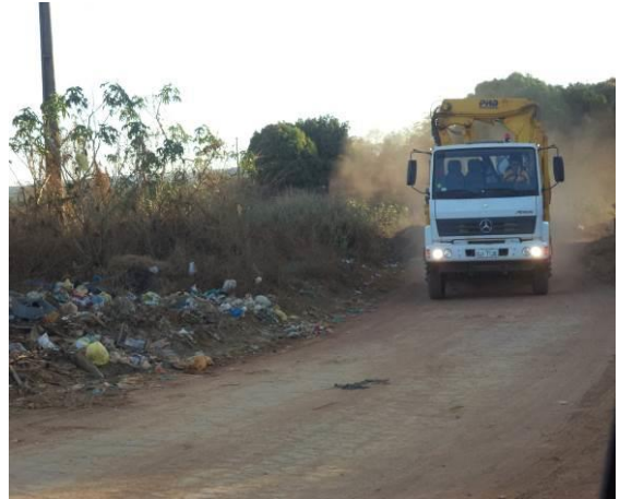
Foto 34: Condições da pavimentação e tráfego de veículos pesados na localidade Vila Ildemar, em Açailândia - MA.