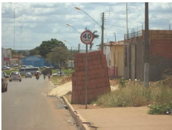
Foto 15: Sinalização e iluminação pública existentes na localidade Residencial Tropical, em Açailândia - MA.