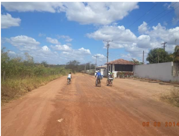
Foto 75: Tráfego de moradores na via de Acesso AC03, Açailândia - MA.