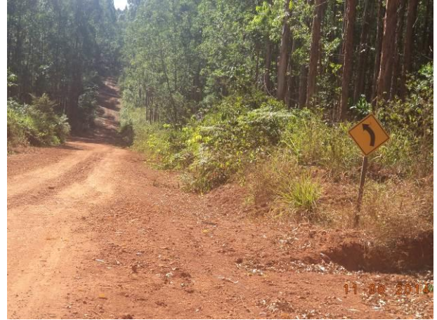
Foto 94: Presença de sinalização no Acesso AC07, Açailândia - MA.