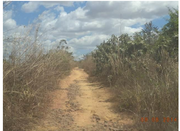
Foto 74: Condições de pavimentação da via de Acesso AC03, Açailândia - MA.