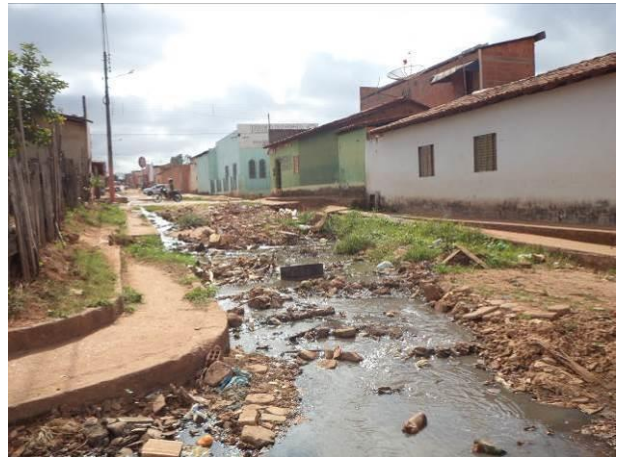
Foto 36: Esgotamento sanitário lançado a céu aberto, na Vila Ildemar, em Açailândia - MA.