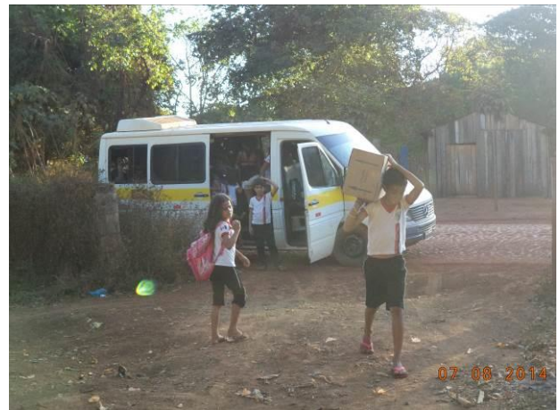
Foto 12: Veículo utilizado para o transporte de alunos da localidade Vila Seringal, em Açailândia - MA.