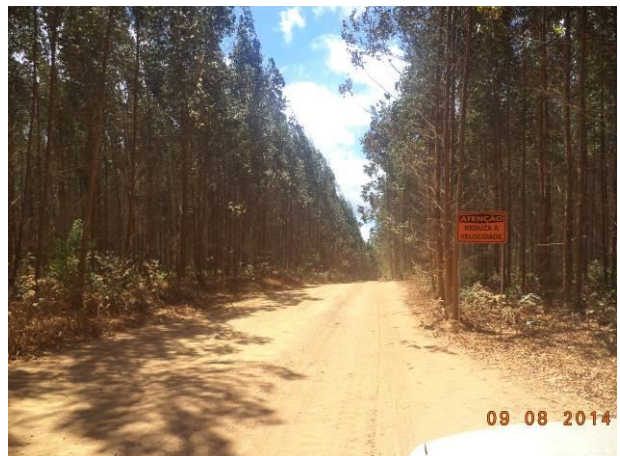
Foto 44: Condições da pavimentação do Acesso Viário AC01B, Açailândia - MA.