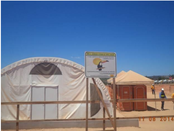
Foto 81: Canteiro de Obras da via de Acesso AC04A, Açailândia - MA.