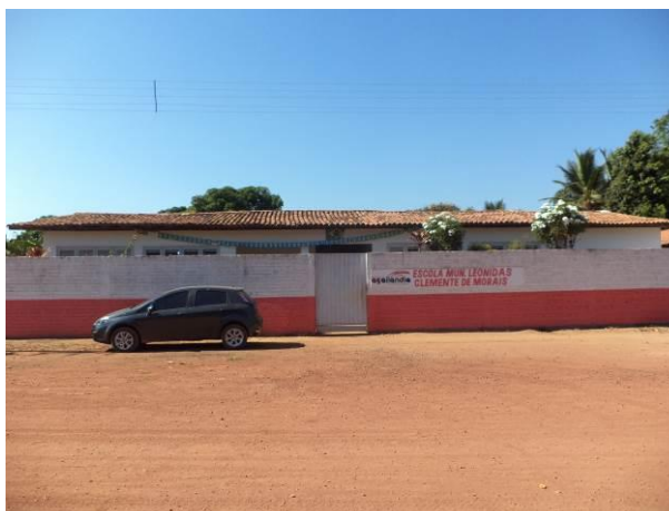
Foto 3: Escola Municipal Leônidas Clemente de Mores, localizada na Vila Reta (Quatro Bocas), em Açailândia - MA.