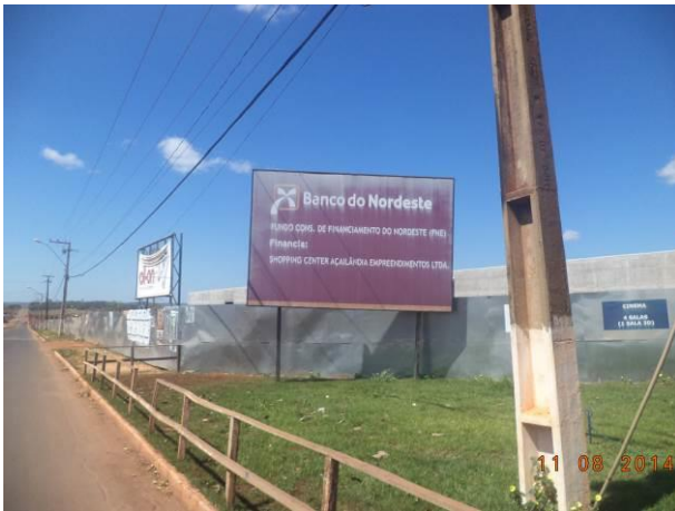
Foto 89: Construção do shopping de Açailândia ao longo da via de Acesso AC04B, Açailândia - MA.