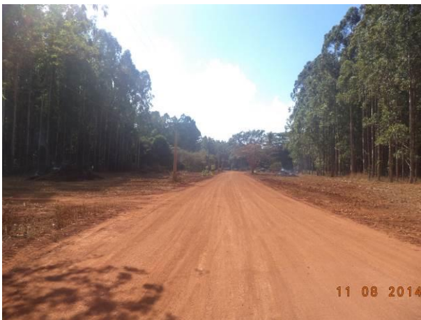
Foto 95: Condições da pavimentação da via de Acesso AC07, Açailândia - MA.