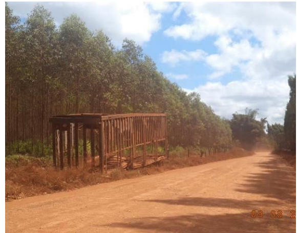
Foto 42: Sucata abandonada às margens do Acesso AC01A, Açailândia - MA.