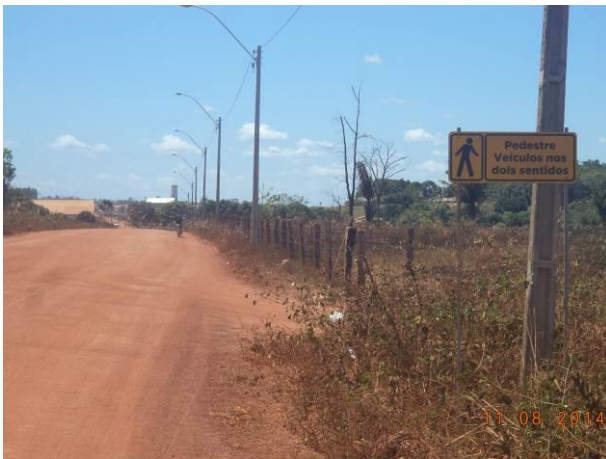
Foto 83: Iluminação pública na via de Acesso AC04A, Açailândia - MA.