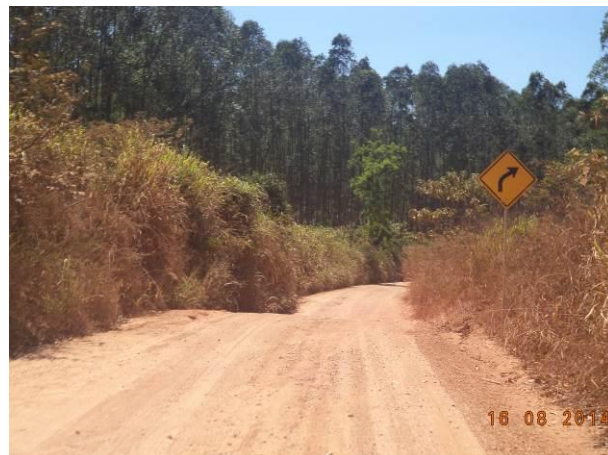
Foto 62: Presença de sinalização na via de Acesso AC02.1, Açailândia - MA.