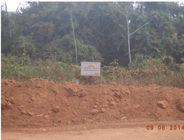
Foto 47: Corte realizado às margens do Acesso Viário AC01B, Açailândia - MA.