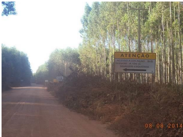
Foto 37: Sinalização existente no Acesso Viário AC01A, Açailândia - MA.