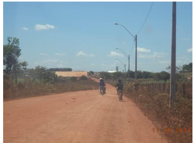
Foto 84: Tráfego de moradores ao longo da via de Acesso AC04A, Açailândia - MA.