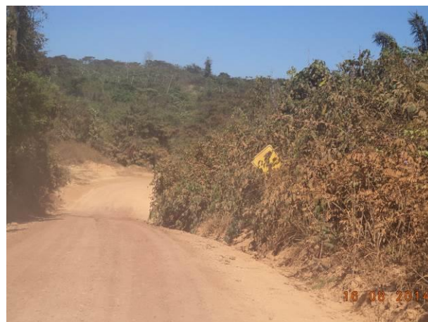
Foto 64: Sinalização coberta pela vegetação no Acesso AC02.1, Açailândia - MA.