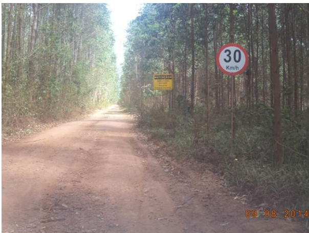
Foto 43: Presença de sinalização no Acesso Viário AC01B, Açailândia - MA.