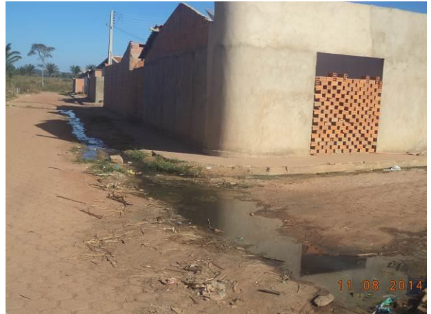
Foto 30: Esgotamento sanitário lançado a céu aberto na Vila Juscelino, em Açailândia - MA.