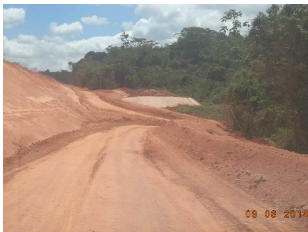
Foto 51: Trecho do Acesso AC01C com grande quantidade de material particulado, Açailândia - MA.