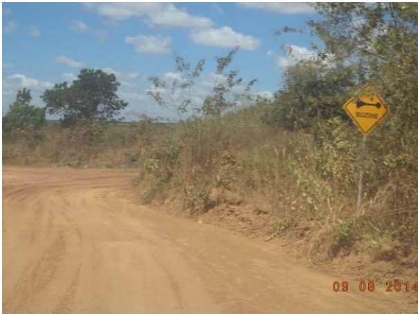
Foto 73: Sinalização coberta pela vegetação na via de Acesso AC03, Açailândia - MA.