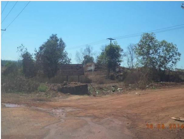
Foto 71: Resíduos sólidos jogados ao longo do Acesso AC02.2, Açailândia - MA.