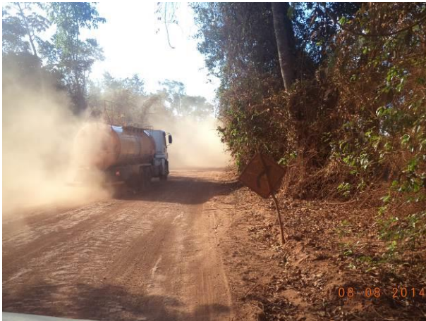
Foto 41: Suspensão de partículas devido ao tráfego de veículos pesados na via de acesso AC01A, Açailândia - MA.