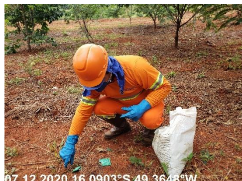
Foto N° 70: Controle fitossanitário na área 0304 Petrolina, km 1495+600 - 1517+000, Data 07/12/20, Coordenadas Geográficas Decimais 16,0903 S; 49,3648