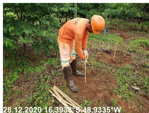
Foto N° 60: Controle de formigas cortadeiras na área 0301, Voçoroca, km 0050+400, Data 28/12/20, Coordenadas Geográficas Decimais 16,3938 S; 48,9335