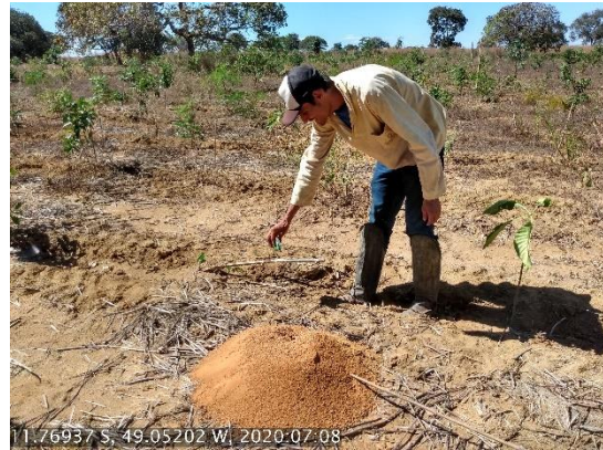
Foto N° 30: Controle fitossanitário na área 0112, UFT, Data 09/07/20, Coordenadas Geográficas Decimais 11,76937 S; 49,05202