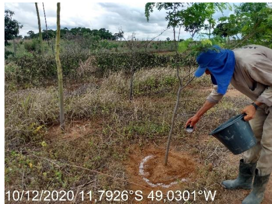
Foto N° 4: Adubação de cobertura na área 0101, Barragem de Gurupi, km 0942+300 a 0958+900, Data 10/12/20, Coordenadas Geográficas Decimais 11.7926 S, 49.0301 W