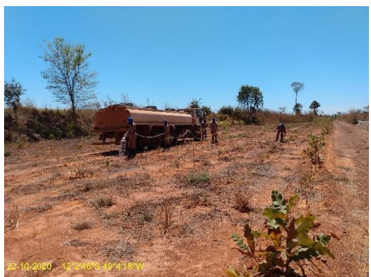
Foto N° 15: Irrigação na área 0105, Cariri, km 0962+800 - 0978+500, Data 22/10/20, Coordenadas Geográficas Decimais 12°2'48" S; 49°4'18" W