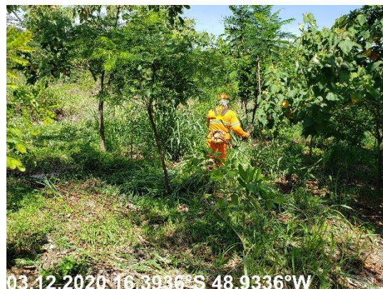
Foto N° 56: Roçada com costal na área 0301, Voçoroca, km 0050+400, Data 03/12/20, Coordenadas Geográficas Decimais 16,3936 S; 48,9336W