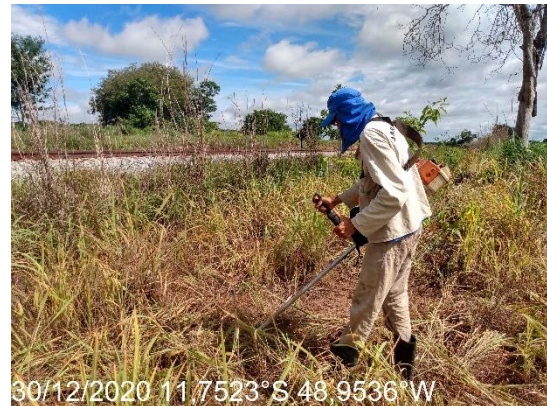
Foto N° 10: Roçada com costal na área 0103, TO 365, km 0924+000 - 0938+100, Data 30/12/20, Coordenadas Geográficas Decimais 11.7523 S; 48.9536 W