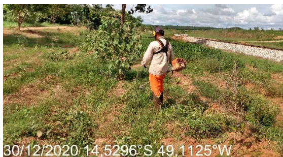
Foto N° 51: Roçada com costal na área 0204C Uruaçu 2, km 1290+100 - 1350+000, Data 30/12/20, Coordenadas Geográficas Decimais 14,5296 S; 49,1125.