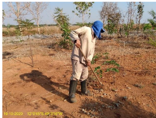
Foto N° 14: Coroamento de mudas na área 0105, Cariri, km 0962+800 - 0978+500, Data 19/10/20, Coordenadas Geográficas Decimais 12°0'45" S; 49°3'16" W