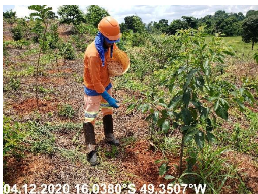
Foto N° 71: Adubação de cobertura na área 0304 Petrolina, km 1495+600 - 1517+000, Data 04/12/20, Coordenadas Geográficas Decimais 16,0380 S; 49,3507 W