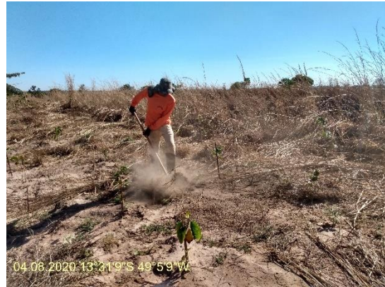
Foto N° 42: Coroamento na área 0202, Mutunópolis, km 1112+500 - 1142+200, Data 04/08/2020, Coordenadas Geográficas Decimais 13°31'9" S; 49°5'9" W