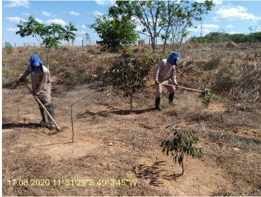
Foto N° 1: Coroamento na área 0101, Gurupi, km 0942+300 a 0958+900, Data 17/08//20, Coordenadas Geográficas Decimais 11.51'29" S, 49.3'45" W