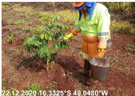
Foto N° 83: Adubação de cobertura na área 0306, Campo Limpo, km 24+200 - 38+500, Data 22/12/20, Coordenadas Geográficas Decimais 16,3325 S; 49,0480 W