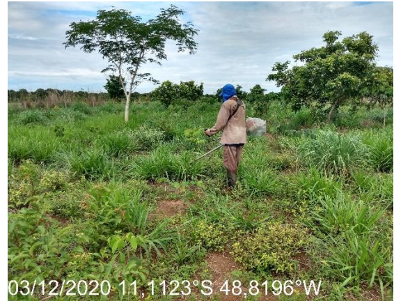
Foto N° 6: Roçada com costal na área 0102, Brejinho de Nazaré, km 0836+900 - 0849+000, Data 03/12/20, Coordenadas Geográficas Decimais 11,1123° S; 48,8196° W