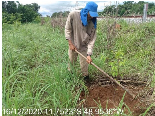
Foto N° 9: Coroamento na área 0103, TO 365, km 0924+000 - 0938+100, Data 16/12/20, Coordenadas Geográficas Decimais 11.7523 S; 48.9536 W