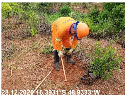
Foto N° 59: Replanteio de mudas na área 0301, Voçoroca, km 0050+400, Data 28/12/20, Coordenadas Geográficas Decimais 16,3931 S; 48,9333 W