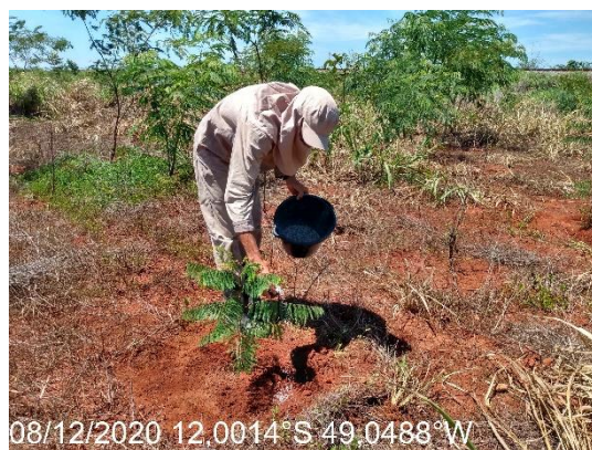
Foto N° 18: Adubação de cobertura na área 0105 Cariri, km 0962+800 - 0978+500, Data 08/12/20, Coordenadas Geográficas Decimais 12,0014 S; 49,0488 W