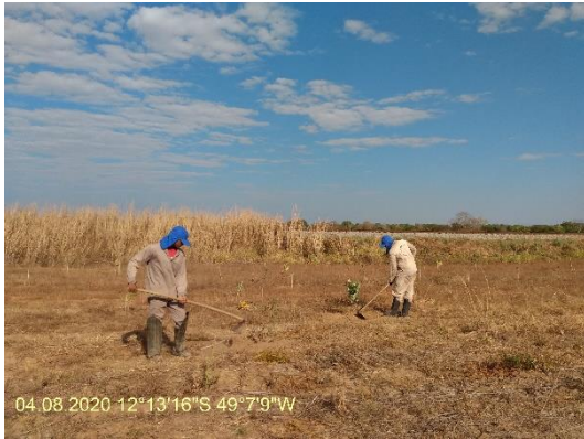
Foto N° 23: Coroamento de mudas na área 0110 Figueirópolis Km 981+100 a 998+500 Data 04/08/20, Coordenadas Geográficas 12°13'16" S; 49°7'9" W