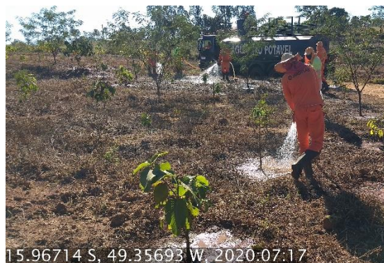
Foto N° 76: Irrigação na área, 0305, Jesópolis, km 1484+000 - 1486+900, Data 17/07/20, Coordenadas Geográficas Decimais 15,96714 S; 49,35693 W