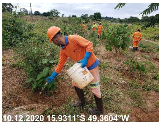
Foto N° 78: Adubação de cobertura na área 0305, Jesópolis, km 1484+000 - 1486+900, Data 010/12/20, Coordenadas Geográficas Decimais 15,9311 S; 49,3604 W