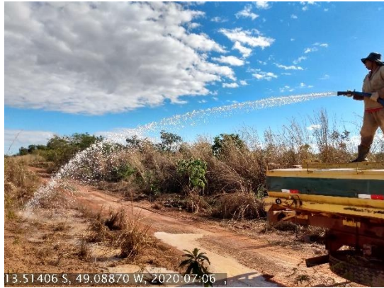
Foto N° 41: Irrigação da área 0202, Mutunópolis, km 1112+500 - 1142+200, Data 06/07/2020, Coordenadas Geográficas Decimais 13.51406 S; 49,08870 W