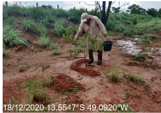
Foto N° 44: Adubação de cobertura na área 0202, Mutunópolis, km 1112+500 - 1142+200 Data 18/12/2020, Coordenadas Geográficas Decimais 13.55547 S; 49,0920 W