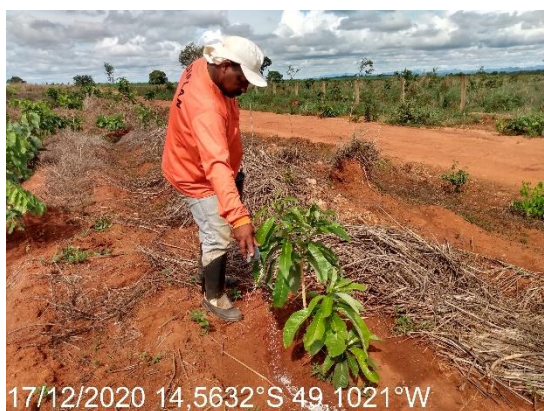
Foto N° 53: Adubação de cobertura na área 0204C Uruaçu 2, km 1290+100 - 1350+000, Data 17/12/20, Coordenadas Geográficas Decimais 14,5632 S; 49,1021