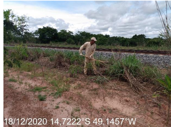
Foto N° 46: Roçada manual na área 0204 Uruaçu, km 1305+500 - 1317+700, Data 18/02/20, Coordenadas Geográficas Decimais 14,7222 S; 49,1457 W