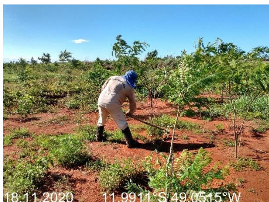
Foto N° 17: Coroamento na área 0105 Cariri, km 0962+800 - 0978+500, Data 18/11/20, Coordenadas Geográficas Decimais 11,9911 S; 49,0515 W