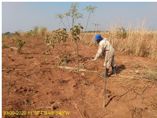
Foto N° 13: Coroamento de mudas na área 0105, Cariri, km 0962+800 - 0978+500, Data 30/09/20, Coordenadas Geográficas Decimais 11°57'4" S; 49,3'43"W