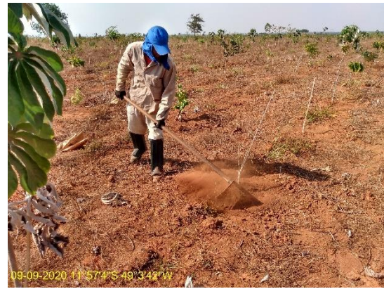
Foto N° 20: Coroamento na área 0105C, Cariri complemento, km 0963+600 - 964,300, Data 09/09/20, Coordenadas Geográficas 11°57'4" S; 49°3'42" W