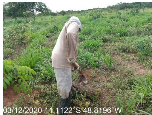
Foto N° 8: Coroamento na área 0102, Brejinho de Nazaré, km 0836+900 - 0849+000, Data 03/12/20, Coordenadas Geográficas Decimais 11,1122 S; 48,8196 W