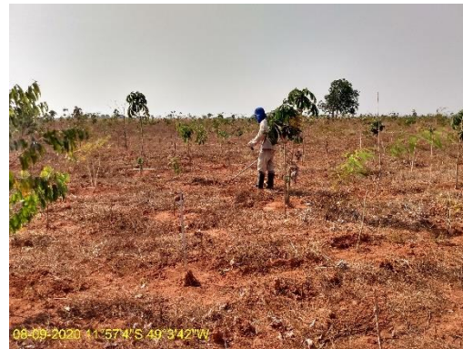
Foto N° 22: Roçada mecanizada na área 0105C, Cariri complemento, km 0963+600 - 964,300, Data 08/09/20, Coordenadas Geográficas 11°57'4" S; 49°3'42" W