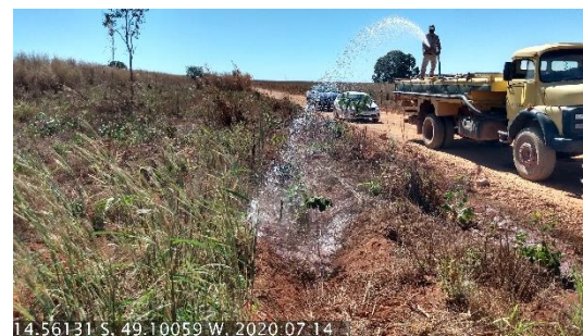
Foto N° 52: Irrigação de mudas na área , 0204C Uruaçu 2, km 1290+100 - 1350+000, Data 14/07/20, Coordenadas Geográficas Decimais 14,56131 S; 49,10059