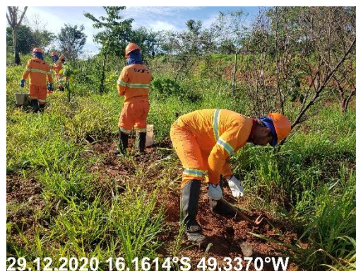
Foto N° 72: Replanteio de mudas na área 0304 Petrolina, km 1495+600 - 1517+000, Data 29/12/20, Coordenadas Geográficas Decimais 16,1614 S; 49,3370W.