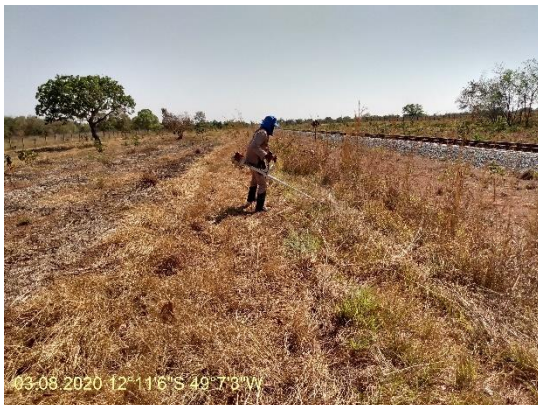
Foto N° 27: Roçada com costal na área 0110 Figueirópolis Km 981+100 a 998+500 Data 03/08/20, Coordenadas Geográficas 12°11'6" S; 49°7'3" W