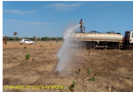
Foto N° 26: Irrigação na área 0110 Figueirópolis Km 981+100 a 998+500 Data 17/09/20, Coordenadas Geográficas 12°10'21" S; 49°6'43" W