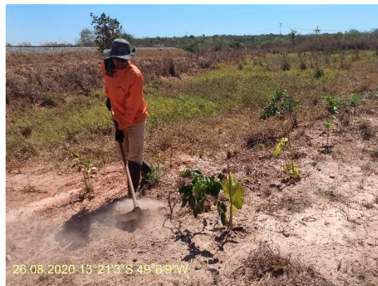
Foto N° 36: Roçada manual na área 0201 Vale da Lua Km 1112+500 - 1142+200, Data 26/08/20, Coordenadas Geográficas Decimais 13°21'31"; 49°6'9" W