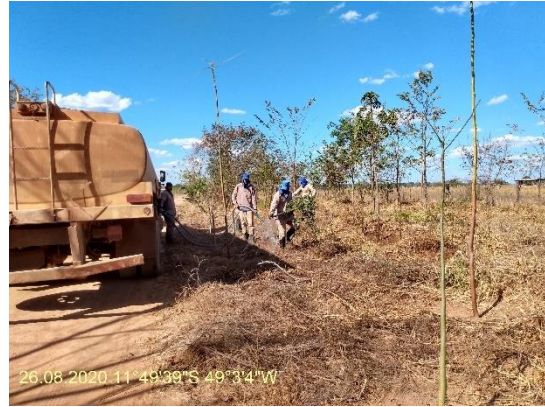
Foto N° 2: Irrigação na área 0101, km 0942+300 a 0958+900, Data 28/08/20, Coordenadas Geográficas Decimais 11°49'39" S, 49°3'4" W