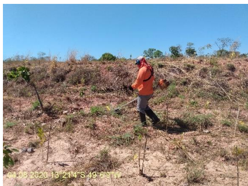
Foto N° 37: Roçada com costal na área 0201 Vale da Lua Km 1112+500 - 1142+200, Data 04/08/20, Coordenadas Geográficas Decimais 13°21'4"S; 49°6'9" W