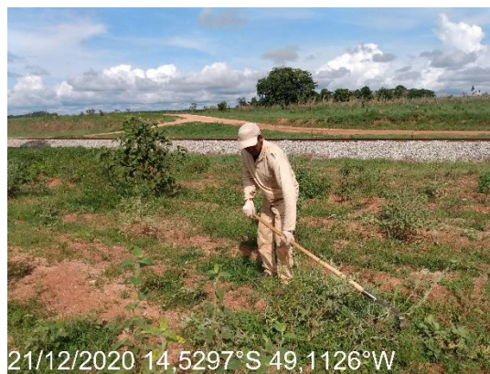
Foto N° 50: Roçada manual na área 0204C Uruaçu 2, km 1290+100 - 1350+000, Data 21/12/20, Coordenadas Geográficas Decimais 14,5297 S; 49,1126 W