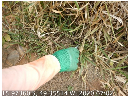
Foto N° 74: Controle fitossanitário na área 0305, Jesópolis, km 1484+000 - 1486+900, Data 02/07/20, Coordenadas Geográficas Decimais 15,97360 S; 49,35514 W