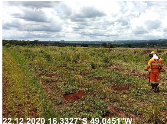
Foto N° 80: Roçada com costal na área 0306, Campo Limpo, km 24+200 - 38+500, Data 22/12/20, Coordenadas Geográficas Decimais 16,3327 S; 49,0451 W