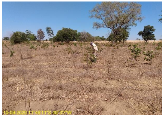
Foto N° 31: Roçada com costal na área 0112, UFT, Data 10/09/20, Coordenadas Geográficas 11°46'11" S; 49,03'7"W