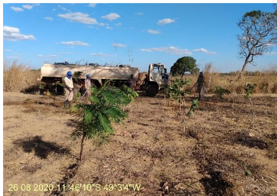
Foto N° 33: Irrigação de mudas na área 0112, UFT, Data 26/08/20, Coordenadas Geográficas 11°46'10" S; 49°3'4"