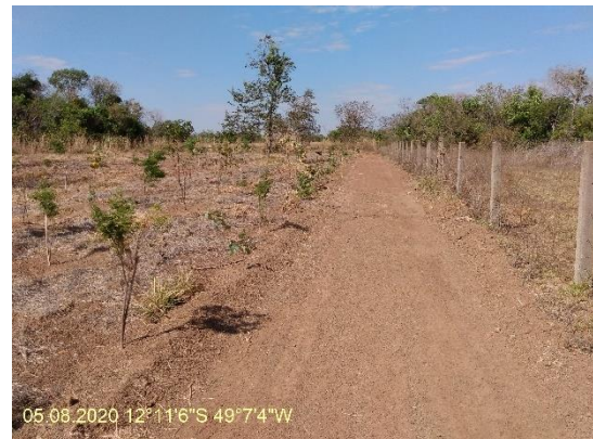
Foto N° 28: Aspecto de aceiro na área 0110 Figueirópolis Km 981+100 a 998+500 Data 05/08/20, Coordenadas Geográficas 12°11'6" S; 49°7'4" W