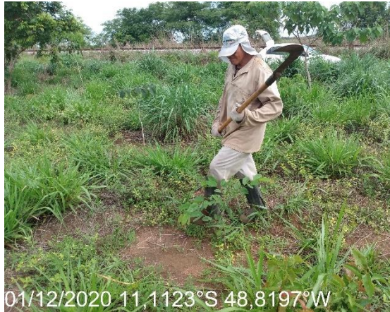
Foto N° 5: Roçada manual na área 0102, Brejinho de Nazaré, km 0836+900 - 0849+000, Data 01/12/20, Coordenadas Geográficas Decimais 11,1123 S; 48,8197 W