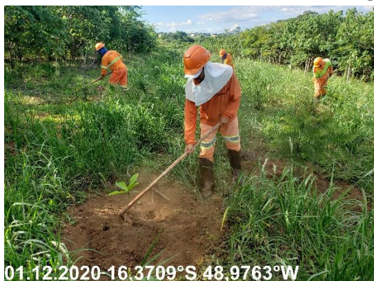
Foto N° 61: Coroamento da área 0302, Parque da Cidade, km 0045+900 - 0042+600, Data 01/12/20, Coordenadas Geográficas Decimais 16, 3709 S; 48,9763 W