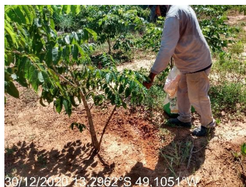
Foto N° 40: Adubação de cobertura na área 0201 Vale da Lua Km 1112+500 - 1142+200, Data 30/12/20, Coordenadas Geográficas Decimais 13,2962 S; 49,1051 W