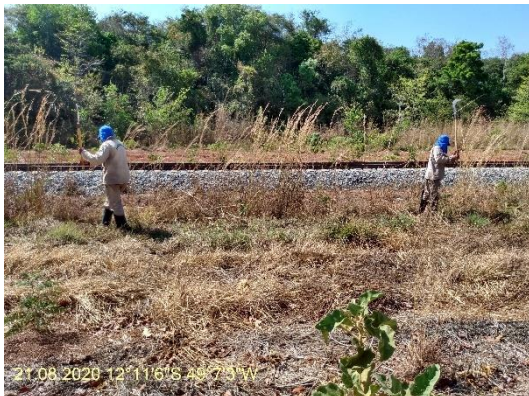
Foto N° 25: Roçada manual na área 0110 Figueirópolis Km 981+100 a 998+500 Data 03/03/20, Coordenadas Geográficas 12°11'6" S; 12°11'6" W