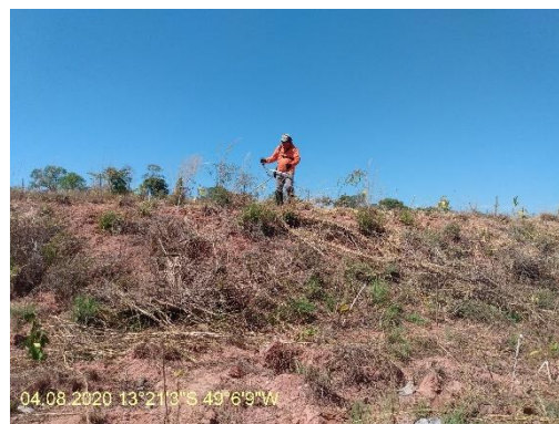
Foto N° 38: Adubação de base para replantio na área 0201 Vale da Lua Km 1112+500 - 1142+200, Data 04/08/20, Coordenadas Geográficas Decimais 13°21'3"S; 49°6'9" W