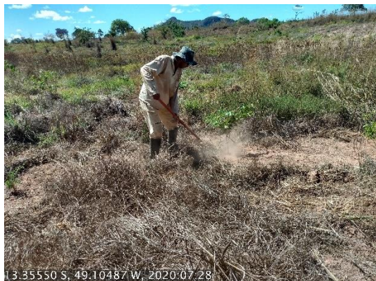
Foto N° 35: Coroamento de mudas na área 0201 Vale da Lua Km 1112+500 - 1142+200, Data 28/07/20, Coordenadas Geográficas Decimais 13,35550S; 49,10487 W