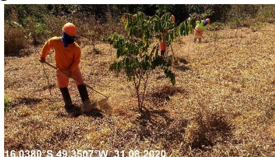
Foto N° 68: Coroamento 0304 Petrolina km 1495+600 - 1517+000, Data 31/08/20, Coordenadas Geográficas Decimais 16,0380 S; 49,3507