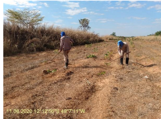
Foto N° 24: Coroamento de mudas na área 0110 Figueirópolis Km 981+100 a 998+500 Data 04/08/20, Coordenadas Geográficas 12°12'56" S; 49°7'11" W