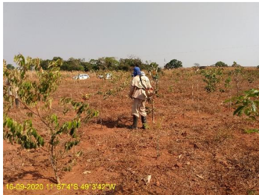
Foto N° 21: Roçada mecanizada na área 0105C, Cariri complemento, km 0963+600 - 964,300, Data 19/09/20, Coordenadas Geográficas 11°57'4" S; 49°3'42" W