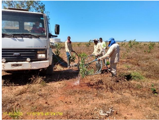
Foto N° 19: Irrigação área 0105C, Cariri complemento, km 0963+600 - 964,300, Data 17/10/20, Coordenadas Geográficas 11°57'8" S; 49°3'41" W