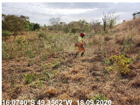
Foto N° 69: Roçada com costal na área 0304 Petrolina, km 1495+600 - 1517+000, Data 18/09/20, Coordenadas Geográficas Decimais 16,0740 S; 49,3562 W