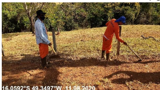
Foto N° 67: Manutenção de aceiro na área 0304, Petrolina km 1495+600 - 1517+000, Data 11/08/20, Coordenadas Geográficas Decimais 16,0592 S; 49,3497