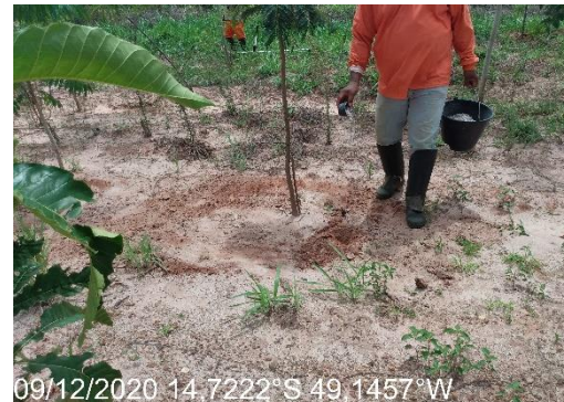
Foto N° 48: Adubação de cobertura na área 0204 Uruaçu, km 1305+500 - 1317+700, Data 09/12/20, Coordenadas Geográficas Decimais 14,7222 S; 49,1457 W