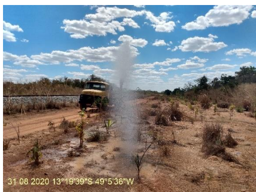
Foto N° 39: Irrigação na área 0201 Vale da Lua Km 1112+500 - 1142+200, Data 31/08/20, Coordenadas Geográficas Decimais 13°19'39"S; 49°5'36" W