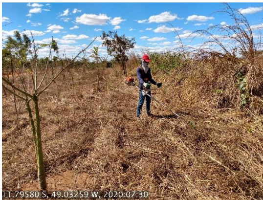
Foto N° 3: Roçada com costal na área 0101, Barragem de Gurupi, km 0942+300 a 0958+900, Data 30/07/20, Coordenadas Geográficas Decimais 11.79580 S, 49.03259 W