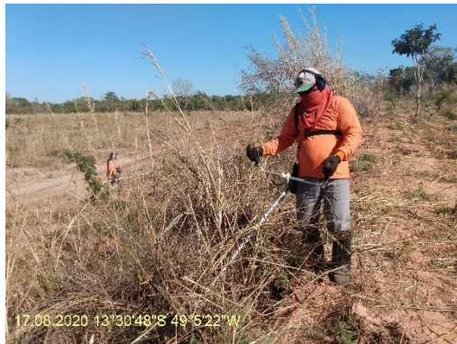
Foto N° 43: Roçada manual na área 0202, Mutunópolis, km 1112+500 - 1142+200, Data 17/08/20, Coordenadas Geográficas Decimais 13°30'48" S; 49°5'22" W