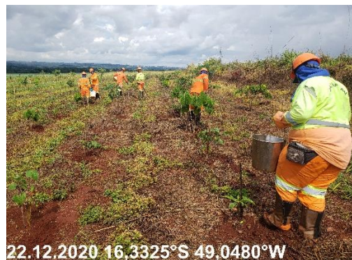
Foto N° 84: Aplicação de isca granulada para controle de formigas na área 0306, Campo Limpo, km 24+200 - 38+500, Data 22/12/20, Coordenadas Geográficas Decimais 16,3325 S; 49,0480 W