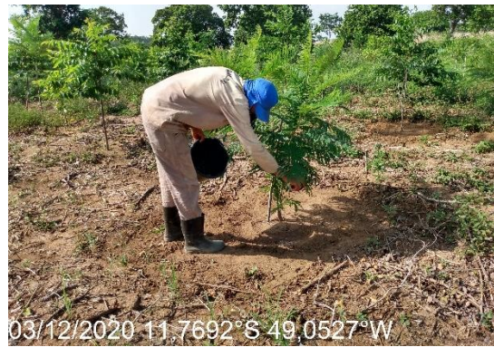
Foto N° 32: Adubação de cobertura na área 0112, UFT, Data 03/12/20, Coordenadas Geográficas Decimais 11,7692 S; 49,0527W