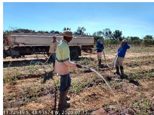
Foto N° 12: Irrigação na área 0103, TO 365, km 0924+000 - 0938+100, Data 15/07/20, Coordenadas Geográficas Decimais 11.72949 S; 48.93974 W