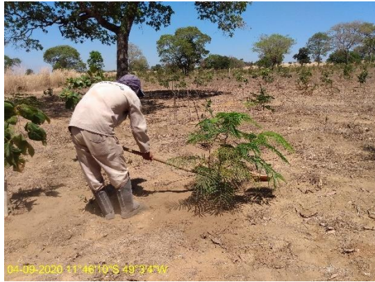
Foto N° 29: Coroamento de mudas na área 0112, UFT, Data 04/09/20, Coordenadas Geográficas 11°46'10" S; 49°3'4"