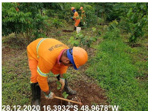
Foto N° 65: Replanto de mudas na área 0302, Parque da Cidade, km 0045+900 - 0042+600, Data 28/12/20, Coordenadas Geográficas Decimais 16,3992 S; 48,9678 W