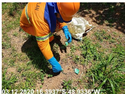
Foto N° 57: Controle fitossanitário na área 0301, Voçoroca, km 0050+400, Data 03/12/20, Coordenadas Geográficas Decimais 16,39373 S; 48,9336 W.