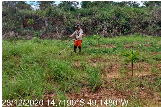
Foto N° 47: Roçada com costal na área 0204 Uruaçu, km 1305+500 - 1317+700, Data 28/12/20, Coordenadas Geográficas Decimais 14,7190 S; 49,1480 W