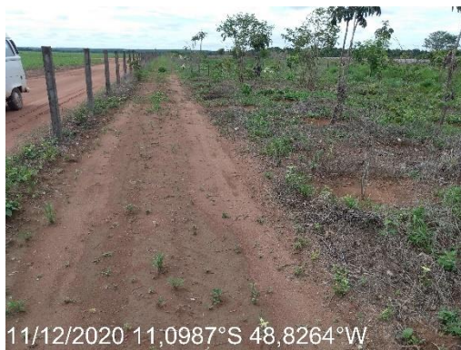
Foto N° 7: Aspecto do aceiramento na área 0102, Brejinho de Nazaré, km 0836+900 - 0849+000, Data 11/12/20, Coordenadas Geográficas Decimais 11,0987 S; 48,8264 W