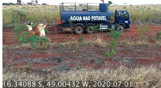
Foto N° 82: Irrigação na área 0306, Campo Limpo, km 24+200 - 38+500, Data 01/07/20, Coordenadas Geográficas Decimais 16,24088 S; 49,00432 W