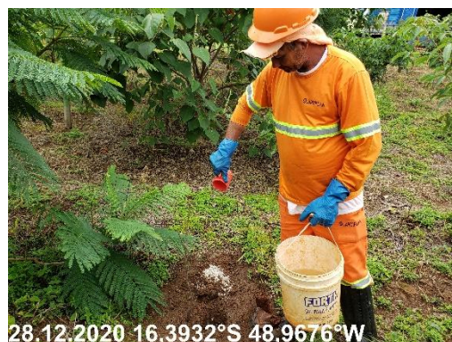
Foto N° 64: Adubação de base para replantio na área 0302, Parque da Cidade, km 0045+900 - 0042+600, Data 28/12/20, Coordenadas Geográficas Decimais 16, 3932 S; 48,9676 W