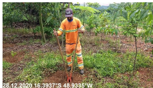
Foto N° 58: Abertura de covas para replantio na área 0301, Voçoroca, km 0050+400, Data 28/12/20, Coordenadas Geográficas Decimais 16,3937 S; 48,9335 W.