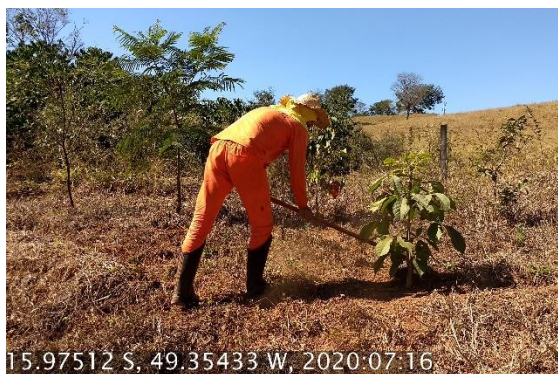
Foto N° 75: Coroamento na área 0305, Jesópolis, km 1484+000 - 1486+900, Data 16/07/20, Coordenadas Geográficas Decimais 15,97512 S; 49,35433 W