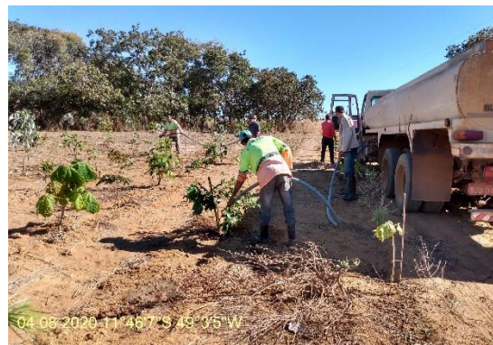
Foto N° 34: Irrigação de mudas na área 0112, UFT, Data 04/03/20, Coordenadas Geográficas 11°46'7" S; 49°3'5" W