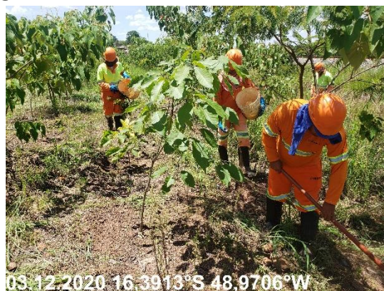
Foto N° 62: Coroamento da área 0302, Parque da Cidade, km 0045+900 - 0042+600, Data 03/12/20, Coordenadas Geográficas Decimais 16, 3913 S; 48,9706 W