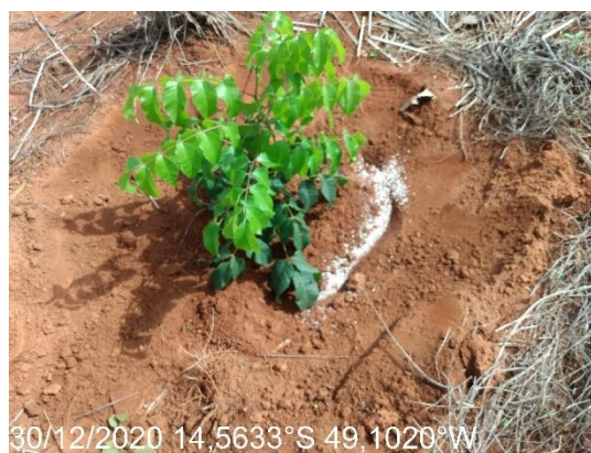
Foto N° 54: Adubação de cobertura na área 0204C Uruaçu 2, km 1290+100 - 1350+000, Data 30/12/20, Coordenadas Geográficas Decimais 14,5633 S; 49,1020