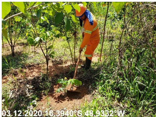
Foto N° 55: coroamento de mudas na área 0301, Voçoroca, km 0050+400, Data 03/12/20, Coordenadas Geográficas Decimais 16,3940 S; 48,9332