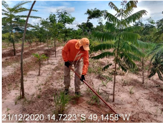
Foto N° 45: Coroamento na área 0204 Uruaçu, km 1305+500 - 1317+700, Data 21/12/20, Coordenadas Geográficas Decimais 14,7223 S; 49,1458 W