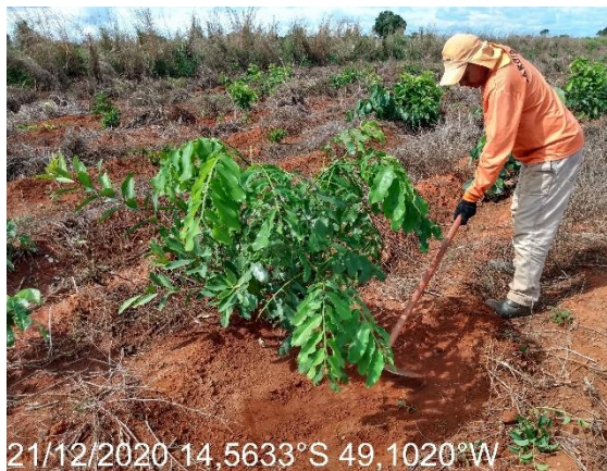
Foto N° 49: Coroamento na área 0204C Uruaçu 2, km 1290+100 - 1350+000, Data 21/12/20, Coordenadas Geográficas Decimais 14,5633 S; 49,1020 W