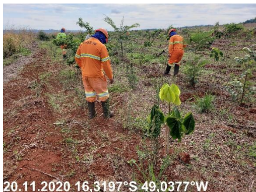
Foto N° 81: Semeadura de leguminosas na área 0306, Campo Limpo, km 24+200 - 38+500, Data 20/11/20, Coordenadas Geográficas Decimais 16,3197 S; 49,0377