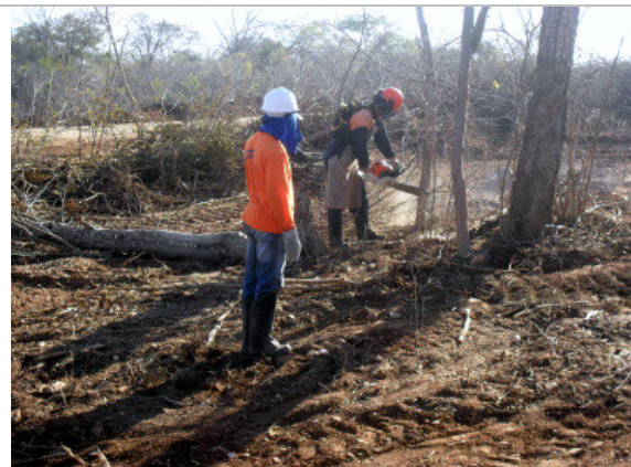
Foto 8 – Atividade de supressão de vegetação por motosserra no Lote 4.