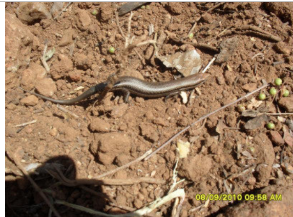
Foto 26 – Briba-brilhante ( Mabuya heathi ) remanejada no Lote 4.