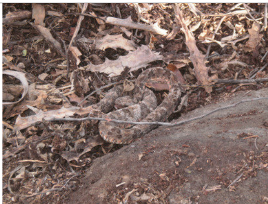
Foto 29 – Jararaca ( Bothropoides erythromelas ) remanejada no Lote 1.