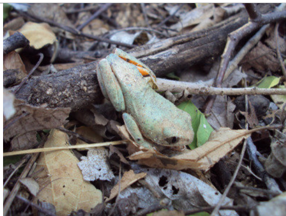
Foto 30 – Perereca-verde ( Phyllomedusa nordestinai ) remanejada no Lote 3.