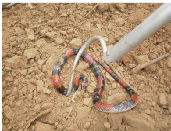
Foto 21 – Falsa-cora ( Oxyrhopus trigeminus ) remanejada no Lote 1.