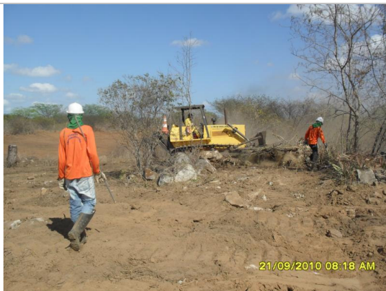
Foto 7 – Atividade de supressão de vegetação por trator no Lote 4.