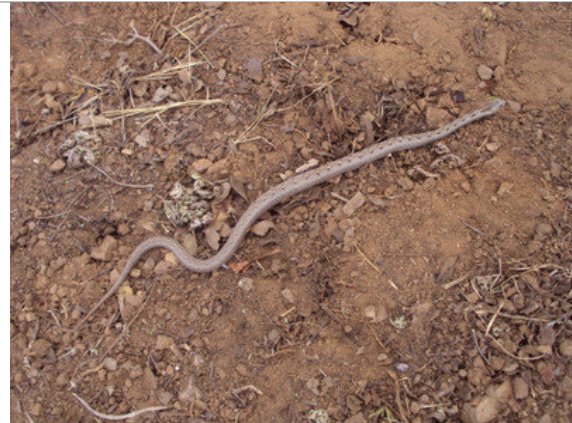
Foto 24 – Jararaquinha ( Thamnodynastes sp) remanejada no Lote 3.