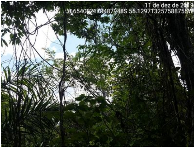
Muita entrada de luz