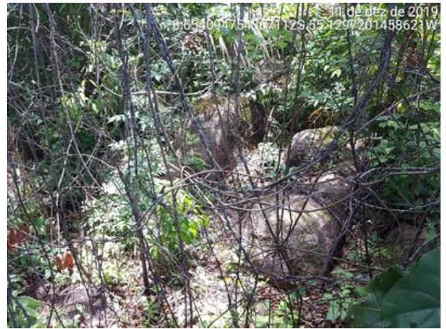
Presença de muito cipó