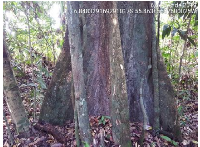
Flor de paca. Sappopemas