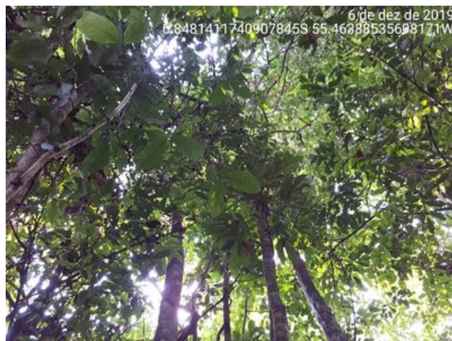
Pouca entrada de luz