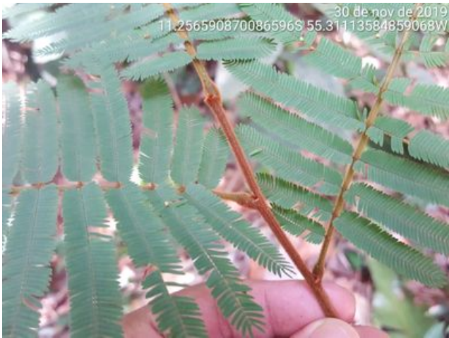
Orelha de macaco