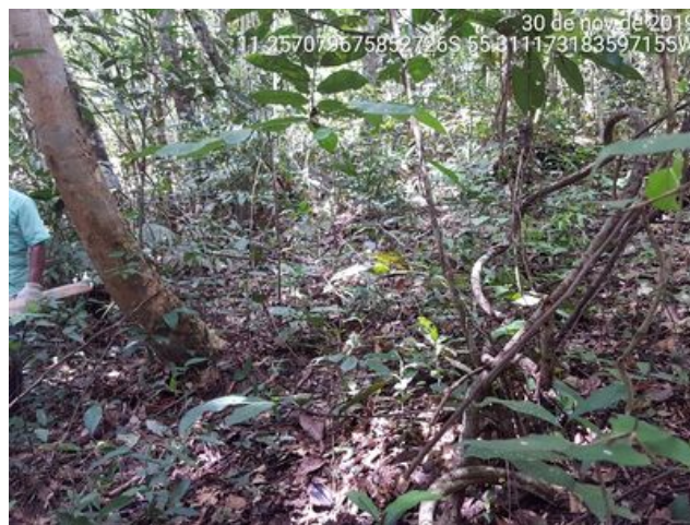
Pouca entrada de luz. Sub-bosque regenerante