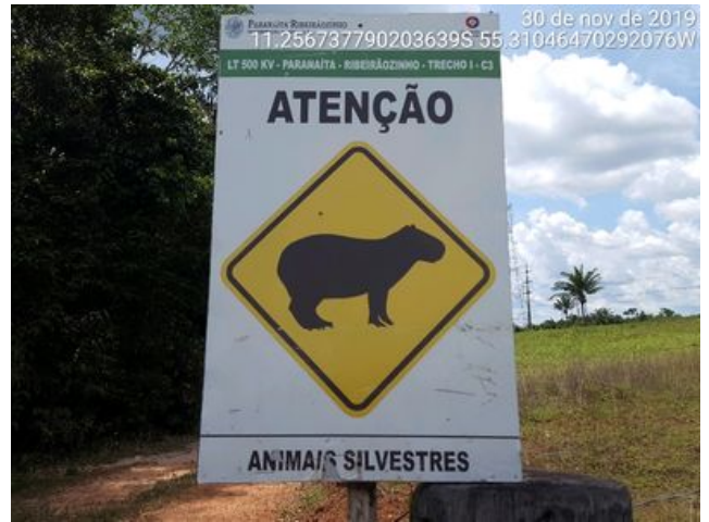
Referência de entrada