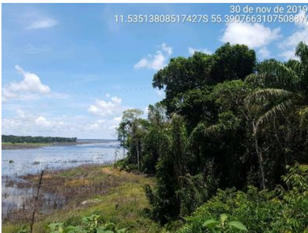
Vegetação na beira do lago da hidroelétrica