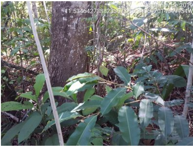
Cipós de pequeno porte