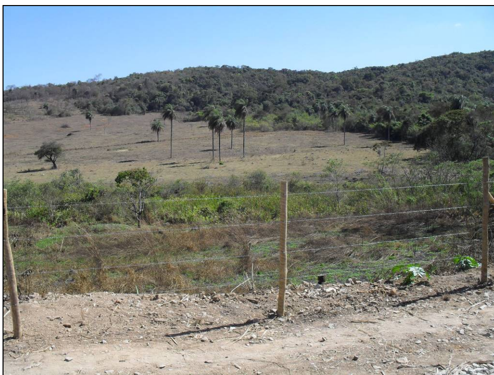
Foto 2 - Vista do entorno da área mostrando pasto com árvores esparsas e remanescente de Floresta Estacional Semidecídua ao fundo.