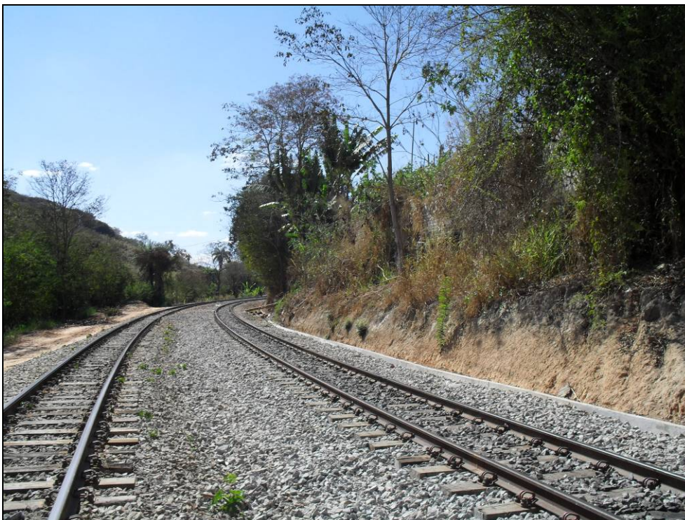
Foto 5 - Talude a ser recuperado na área de ampliação do Pátio Ferroviário de Vianópolis (lado direito).

A área alvo deste PRAD é composta por taludes e plataforma, que apresentam conformações topográficas diferentes entre si. Para os taludes, ilustrados por meio das Fotos 5 e 6, devido à inclinação acentuada, é recomendado o uso da biomanta associado ao plantio de capim Vetiver como forma de recuperação. No caso da plataforma (Foto 7), de topografia plana, recomenda-se a cobertura do solo com a utilização de hidrossemeadura. A seguir, serão descritos os tratamentos supracitados.