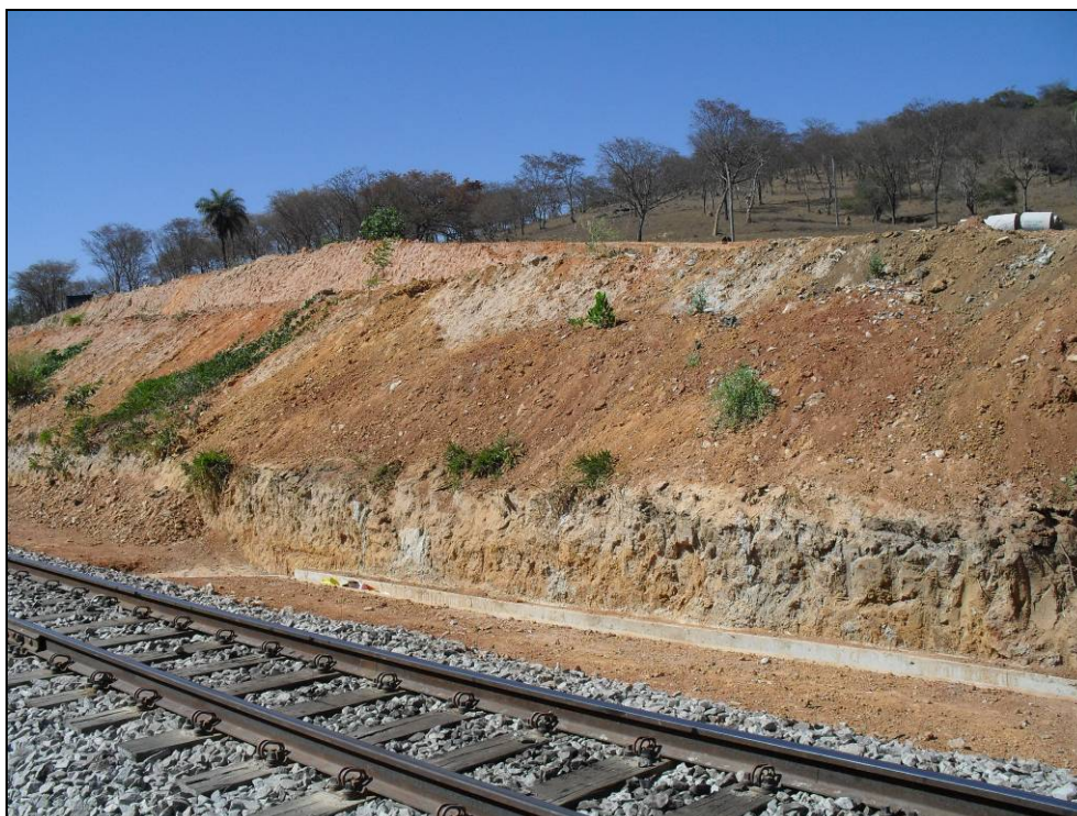
Foto 6 - Talude a ser recuperado na área de ampliação do Pátio Ferroviário de Vianópolis.