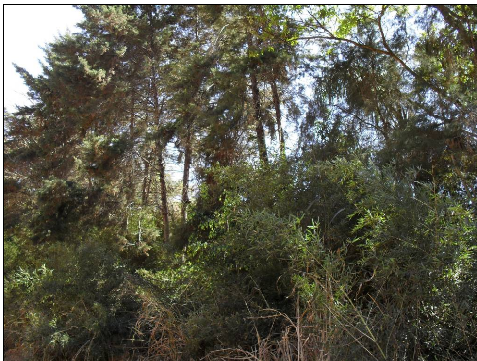
Foto 4 - Vista do entorno da área mostrando pequeno plantio de Pinus sp. ao fundo e Bambusa sp. em primeiro plano.