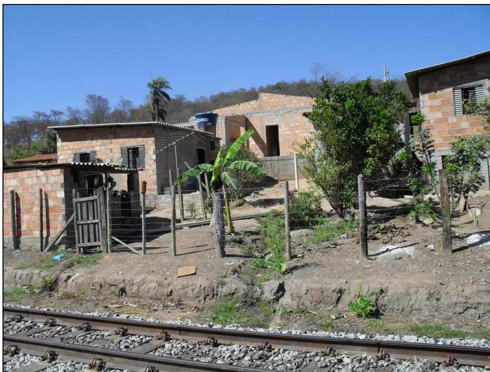
Foto 1 - Vista da área a ser recuperada e entorno mostrando ocupação antrópica na faixa de domínio.