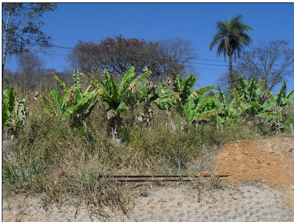
Foto 3 - Vista do entorno da área mostrando pequeno plantio de Musa sp.