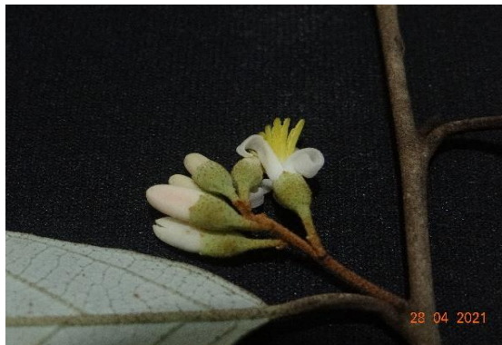
Foto 9: Carne-de-vaca ( Styrax camporum ) Registrado na parcela 07