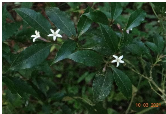
Foto 33: Cafeeiro-do-mato ( Psychotria leiocarpa ) Registrada na parcela 31