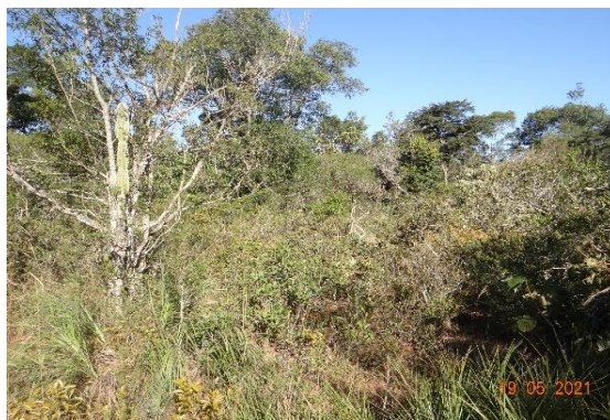
Foto 11: Cerrado sensu stricto registrado na parcela 11, município de Amambai-MS