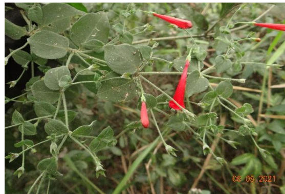
Foto 16: Trepadeira-sanguínea ( Manettia cordifolia ) Registrada na parcela 01 da FES