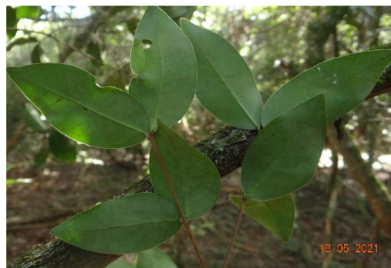
Foto 18: Guamirim ( Eugenia hiemalis ) Registrado na parcela 04 da FES