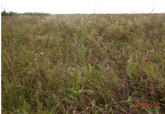
Foto 23: Fitofisionomia de várzea do Rio Paraná, parcela 91 (campo nativo), município de Mundo Novo-MS