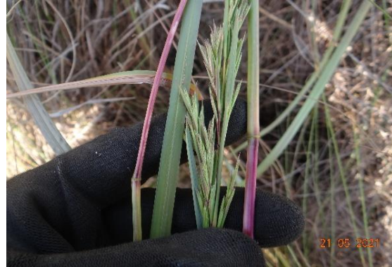
Foto 20: Schizachyrium condensatum registrada na parcela 01 (campo nativo)