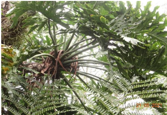
Foto 21: Banana-de-macaco ( Thaumatococcus bipinnatifidum ) registrada na parcela 09 da FES