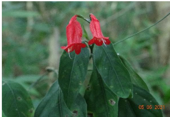
Foto 13: Flor-de-fogo ( Ruellia breviflora ) Registrado na parcela 03 da FES