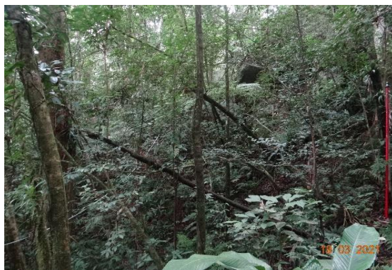
Foto 48: Floresta com sub-bosque denso, registrado em Morretes, PR