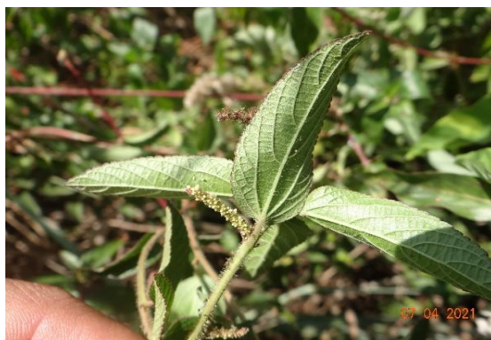
Foto 2: Acalypha communis registrado na parcela 01 (campo nativo)