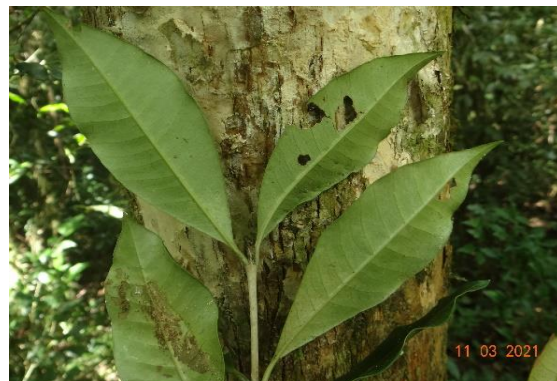
Foto 34: Guamirim ( Myrceugenia gertii ) Registrada na parcela 36 da FOM