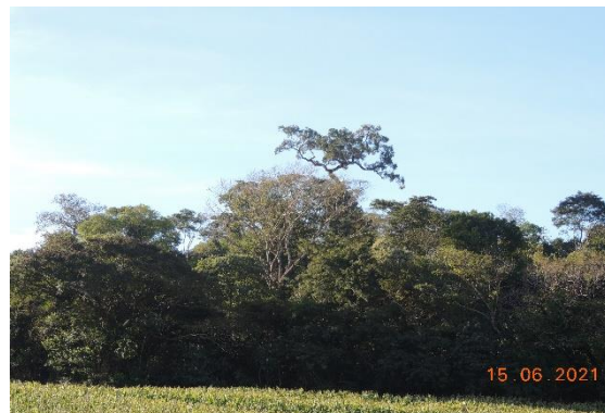
Foto 24: Floresta Estacional Semidecidual no município de São Miguel do Iguçu -PR