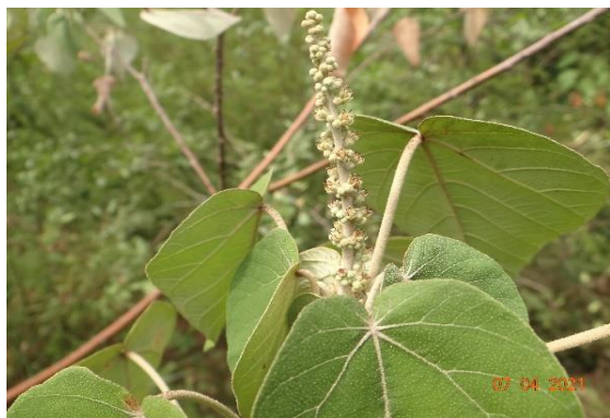
Foto 3: Sangra d'água ( Croton urucurana ) Registrada na parcela 01 (campo nativo)