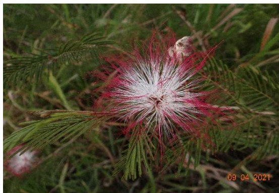
Foto 4: Caliandra ( Calliandra parviflora ) Registrada na parcela 01 (campo nativo)