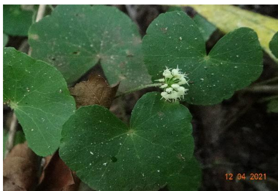
Foto 5: Hydrocotyle leucocephala registrada na parcela 5 (Cerrado)