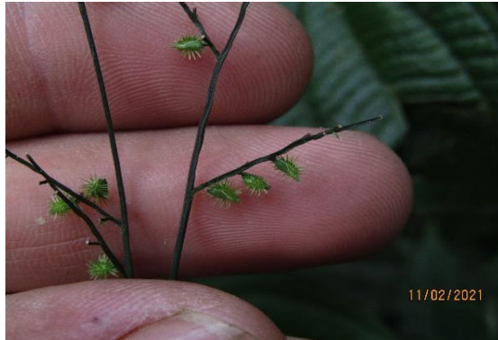
Foto 31: Pseudechinolaena polystachya registrado na parcela 14 da FOM