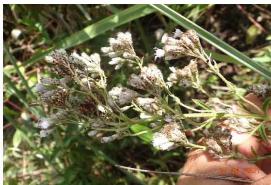
Foto 1: Cromolaena orbygiana registrado na parcela 01 (campo nativo)