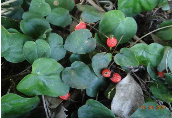
Foto 19: Cauá-pirí ( Geophila repens ) registrado na parcela 05 da FES