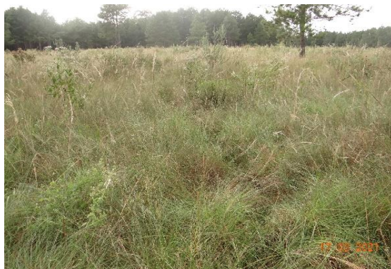
Foto 35: Fitofisionomia de campo nativo (campo nativo) no município de Lapa, PR