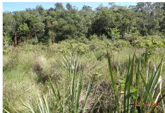
Foto 12: Cerrado com fitofisionomia de campo sujo, registrado na parcela 61 (campo nativo), município de Itaporã-MS