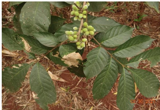
Foto 15: Catiguá ( Trichilia pallida ) registrada na parcela 02 da FES