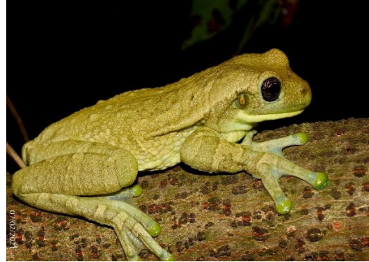
Foto 8: Perereca-Leiteira ( Trachycephalus typhonius ) Registrado na UA7

Fonte: Guilherme Bard Adams (27/04/2021).