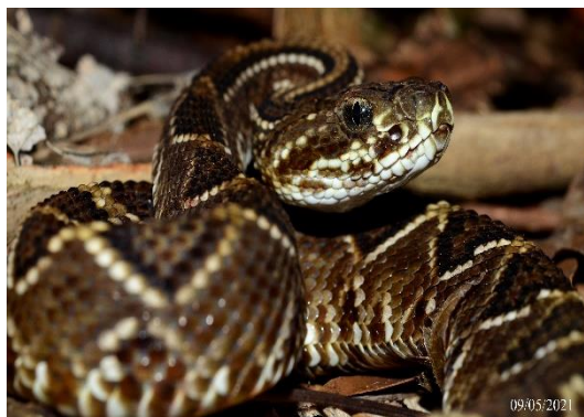
Foto 17: Juvenil de Cascavel ( Crotalus durissus ) Registrado na UA8

Fonte: Guilherme Bard Adams (24/04/2021).