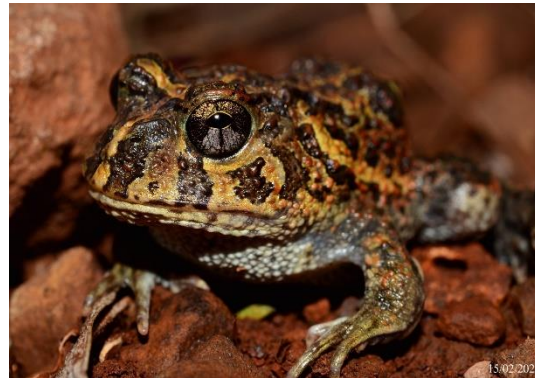
Foto 10: Sapo-da-Chuva ( Odontophrynus americanus ) Registrada na UA6