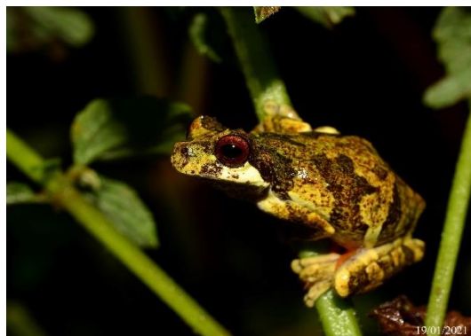
Foto 4: Pererequinha ( Dendropsophus microps ) Fêmea, Registrada na UA2