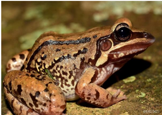
Foto 9: Rã-de-Bigode ( Leptodactylus mystacinus ) Registrado na UA6