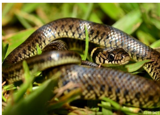
Foto 13: Juvenil de Cobra-Marrom ( Erythrolamprus miliaris ) Registrada na UA3