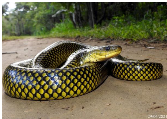
Foto 14: Adulto de Cobra-Marrom ( Erythrolamprus miliaris ) Registrada na UA2

Fonte: Guilherme Bard Adams (29/04/2021).