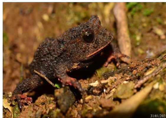
Foto 11: Sapo-da-Chuva ( Proceratophrys avelinoi ) Registrado na UA4