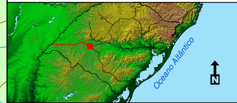
Diagrama Unifilar 01/16: Trecho Cacequi - Uruguiana