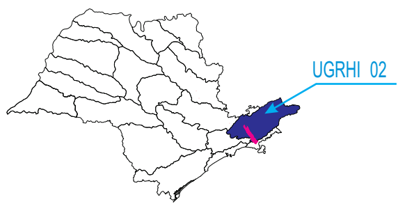
LOCALIZAÇÃO DA UGRHI 02 NO ESTADO DE SÃO PAULO