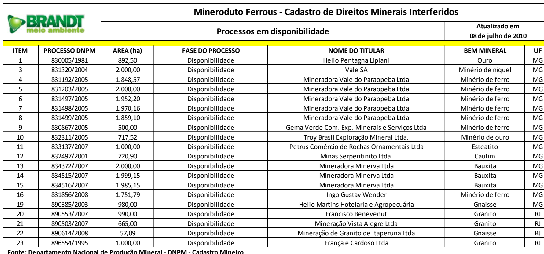
FIGURA 5.5 - Planilha de áreas em disponibilidade