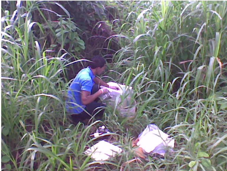
PONTO 91 – SEM NOME