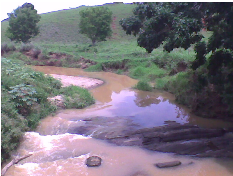
PONTO 93 – CÓRREGO SÃO JOÃO BATISTA