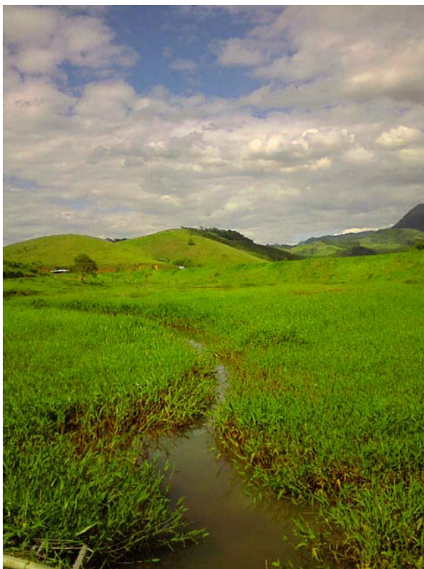
PONTO 66 – CÓRREGO BOA VISTA