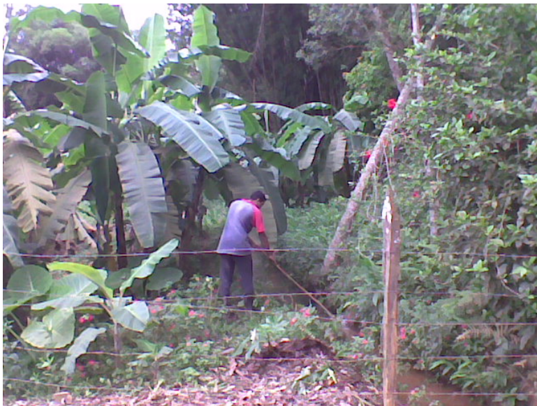
PONTO 51 – CÓRREGO DO LATÃO (BACIA DO RIO)