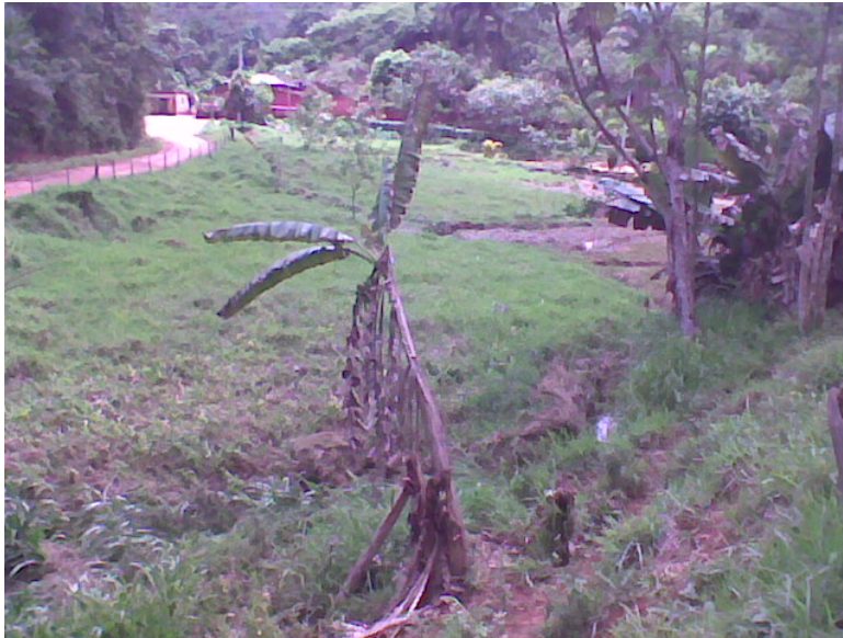
PONTO 62 – CÓRREGO DOS