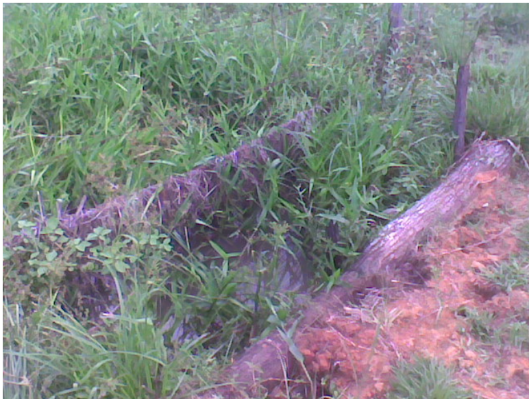
PONTO 75 – CÓRREGO SANTA PAZ