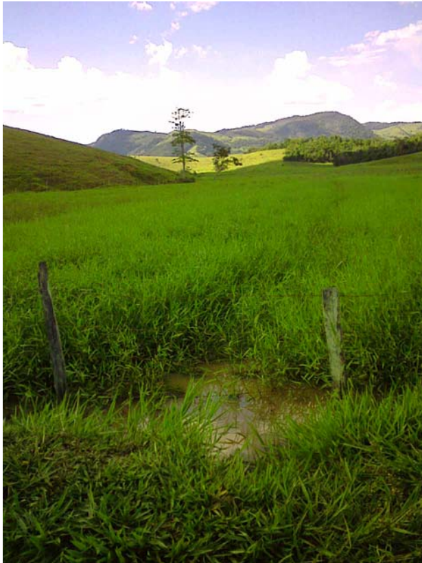
PONTO 73 – AFLUENTE DO CÓRROGO RAPOSO