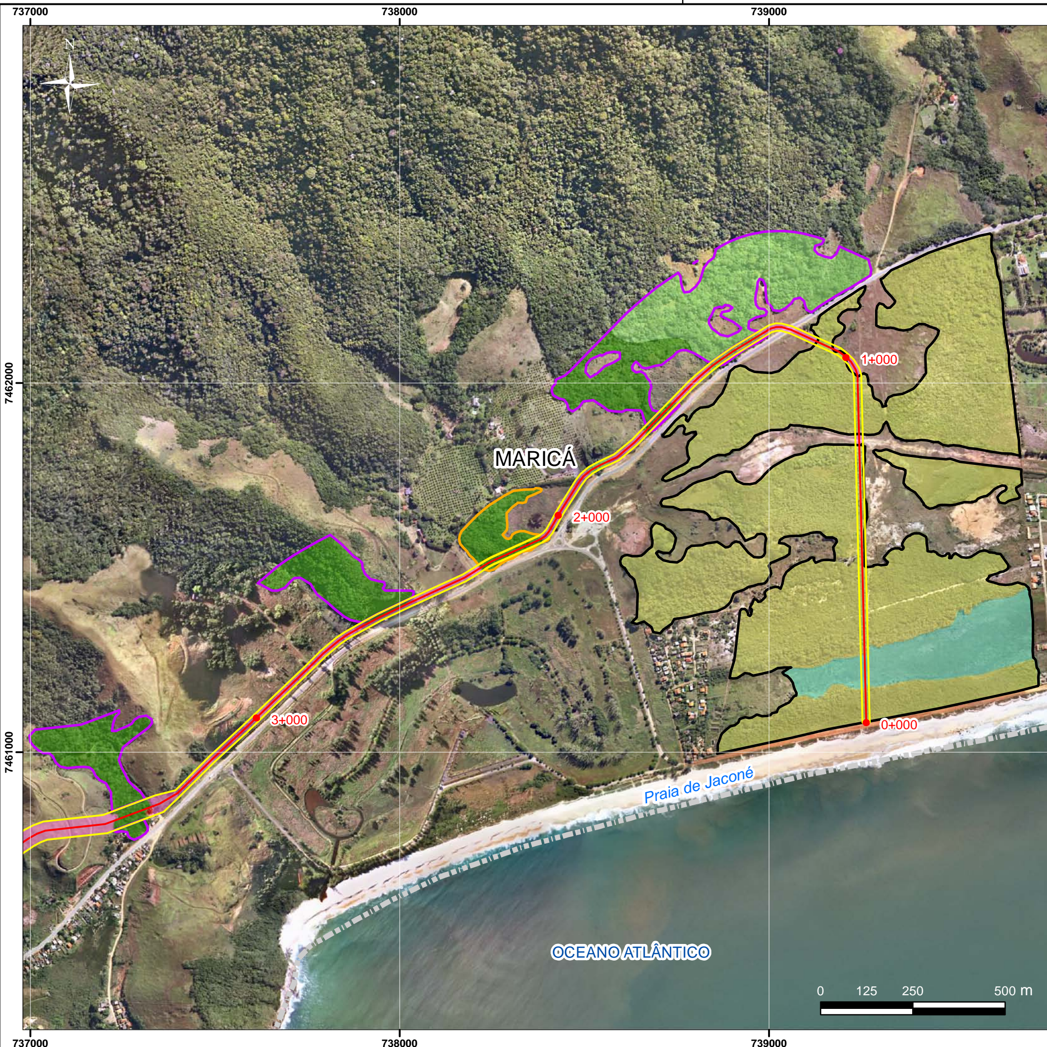
Mapa de Localização