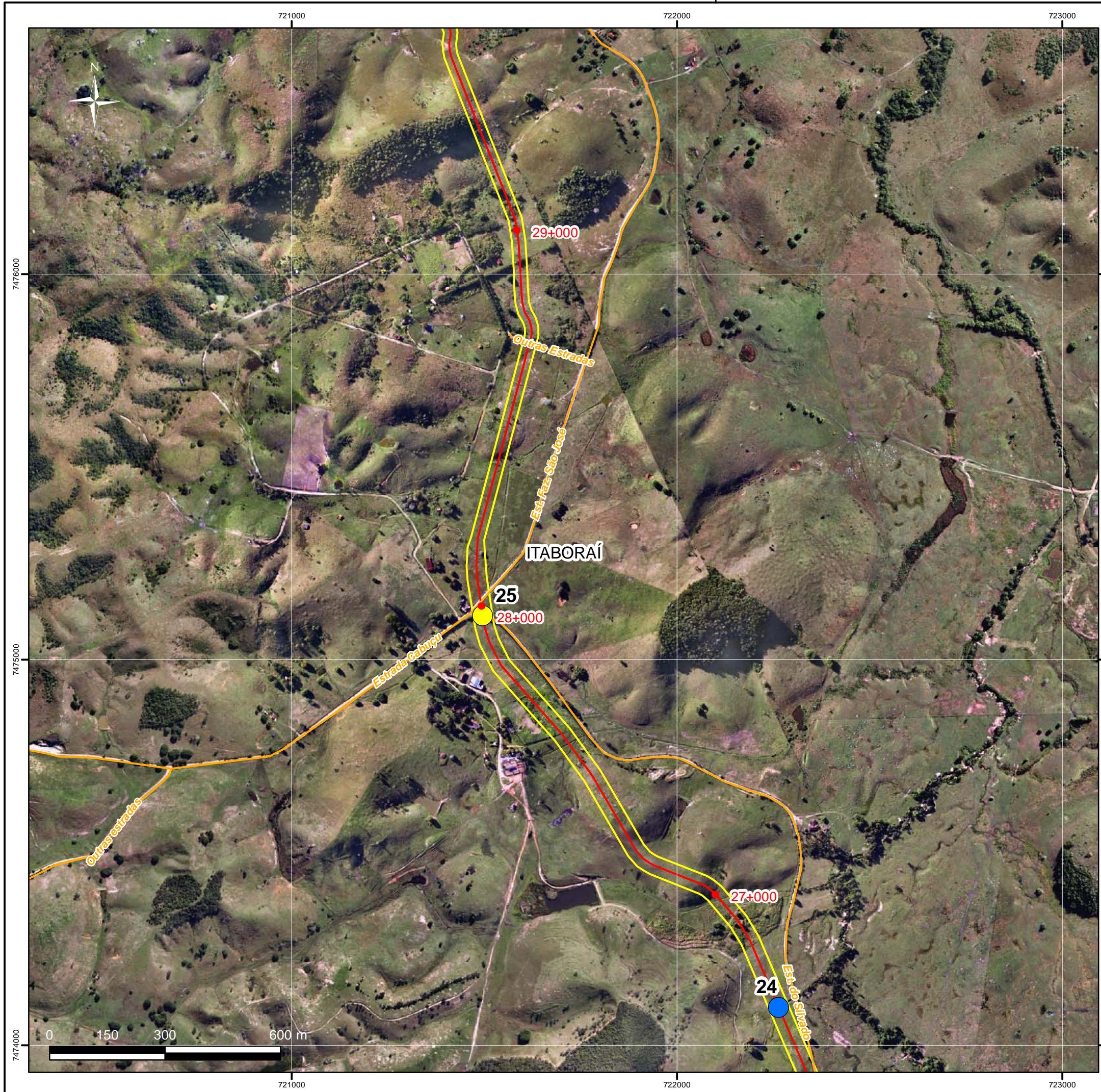
Mapa de Localização