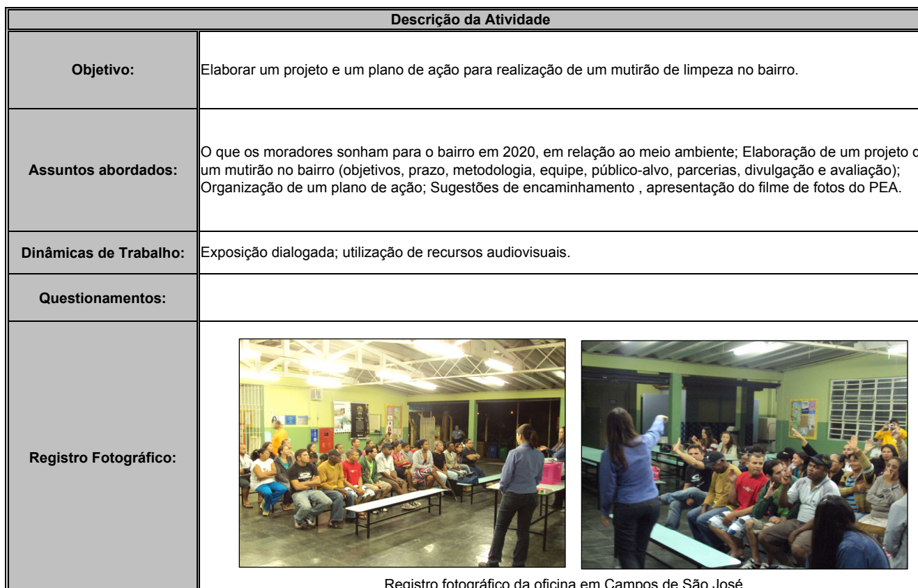
Registro fotográfico da oficina em Campos de São José.