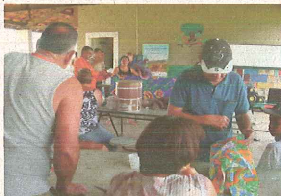
Oficina de reciclagem feita no Programa de Educação Ambiental - 04/02/10