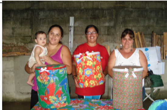
Pufes Confeccionados pelas moradoras