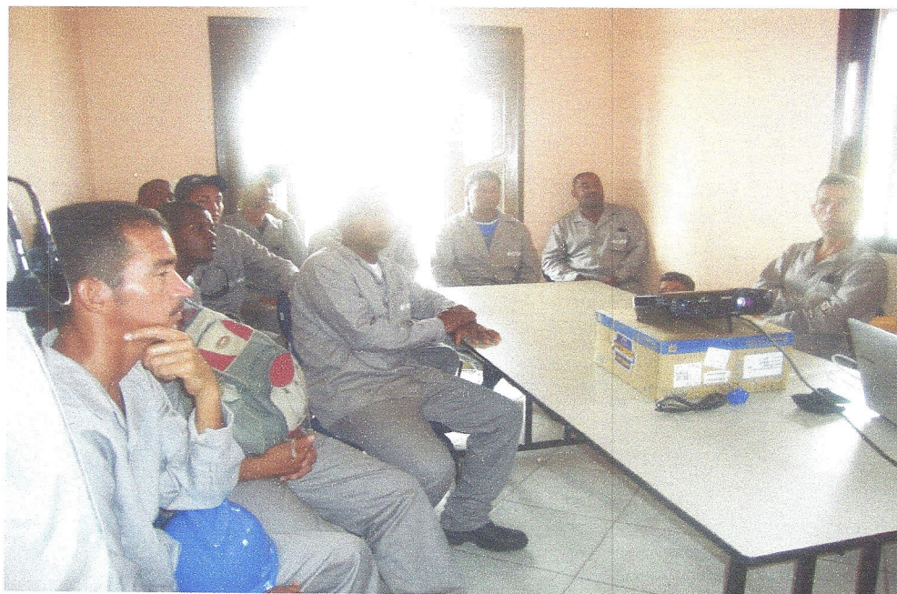
Palestra Meio Ambiente