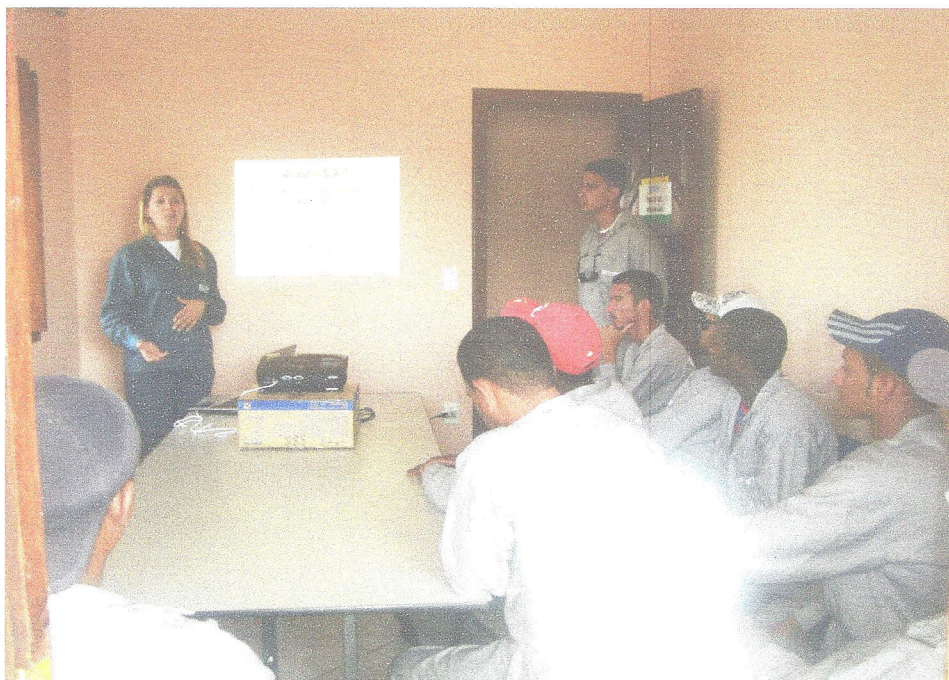
Palestra Meio Ambiente