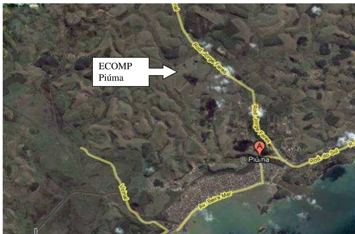
Figura 01: Localização da Estação de Compressão de Piúma/ES (Coordenadas UTM x= 317.920 e y= 7.697.814)

A Estação de Compressão de Piúma – Ecomp Piúma está localizada no Km 203,740 da faixa do Gasoduto Cabiúnas-Vitória (GASCAV), a aproximadamente 4,5 quilômetros da sede do município de Piúma/ES, conforme apresentado na Figura 01 abaixo. Sua instalação faz-se necessária para comprimir e transferir o gás residual proveniente do GASCAV. A Estação é constituída basicamente pelas seguintes instalações: filtragem, compressão e resfriamento, sistema de gás combustível, sistema de descarga de emergência, sistema de compressão de ar, sistema de drenagem oleosa, sistema de proteção de incêndio e utilidades.