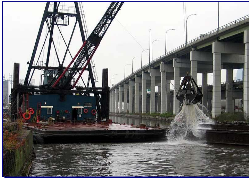
FIGURA 3.4.3-1: CLAM SHELL EM OPERAÇÃO DE DRAGAGEM