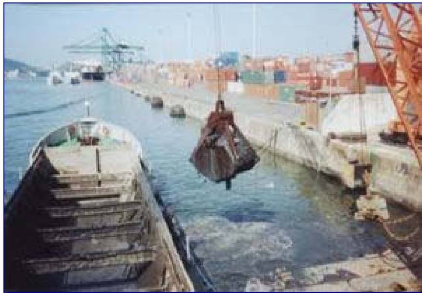
FIGURA 3.4.3-2: CLAM SHELL CARREGANDO BATELÃO