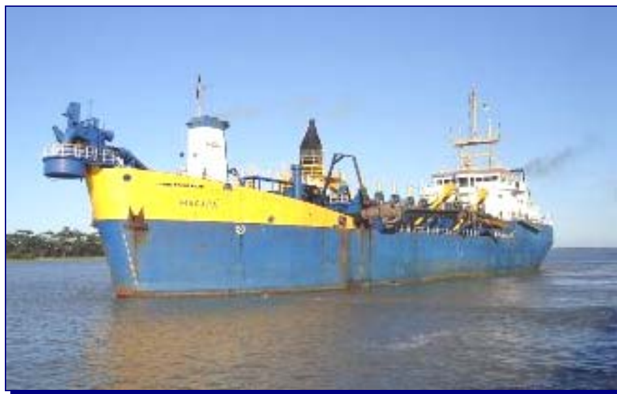
FIGURA 3.4.3-3: DRAGA AUTOTRANSPORTADORA TIPO HOPPER

O ciclo previsto para esta draga é de 10 dias, sendo que serão feitas 12 viagens por dia, com duração de 40 minutos cada uma. O tempo de dragagem propriamente dito é de uma hora e meia. No total serão feitas 119 viagens com uma carga de, aproximadamente, 5.400 m 3 por viagem.