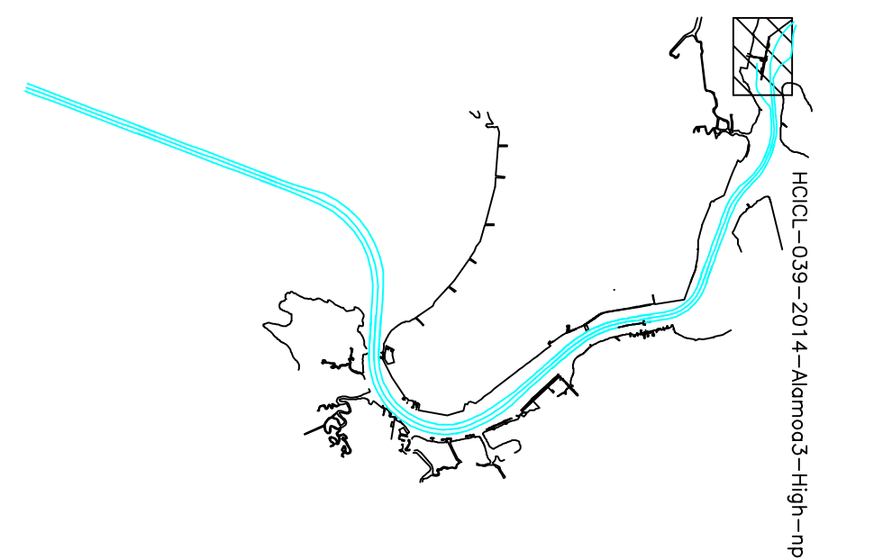
LOCALIZAÇÃO GEOGRÁFICA DAS PLANTAS NO NORTE DE SANTOS-SP