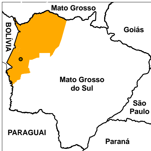
Cartograma de Localização

PROJEÇÃO: UTM "DATUM" HORIZONTAL: WGS-84 BASE CARTOGRÁFICA: AHIPAR (2002) IMAGEM IKONOS (2010)