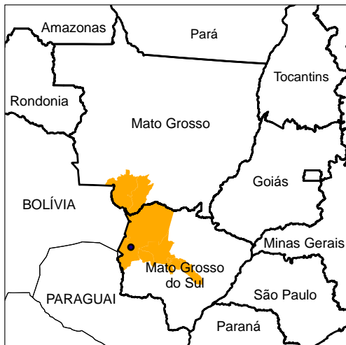
Cartograma de Localização

PROJEÇÃO: UTM "DATUM" HORIZONTAL: WGS-84 BASE CARTOGRÁFICA: IBGE (2010) / AHIPAR (2002)