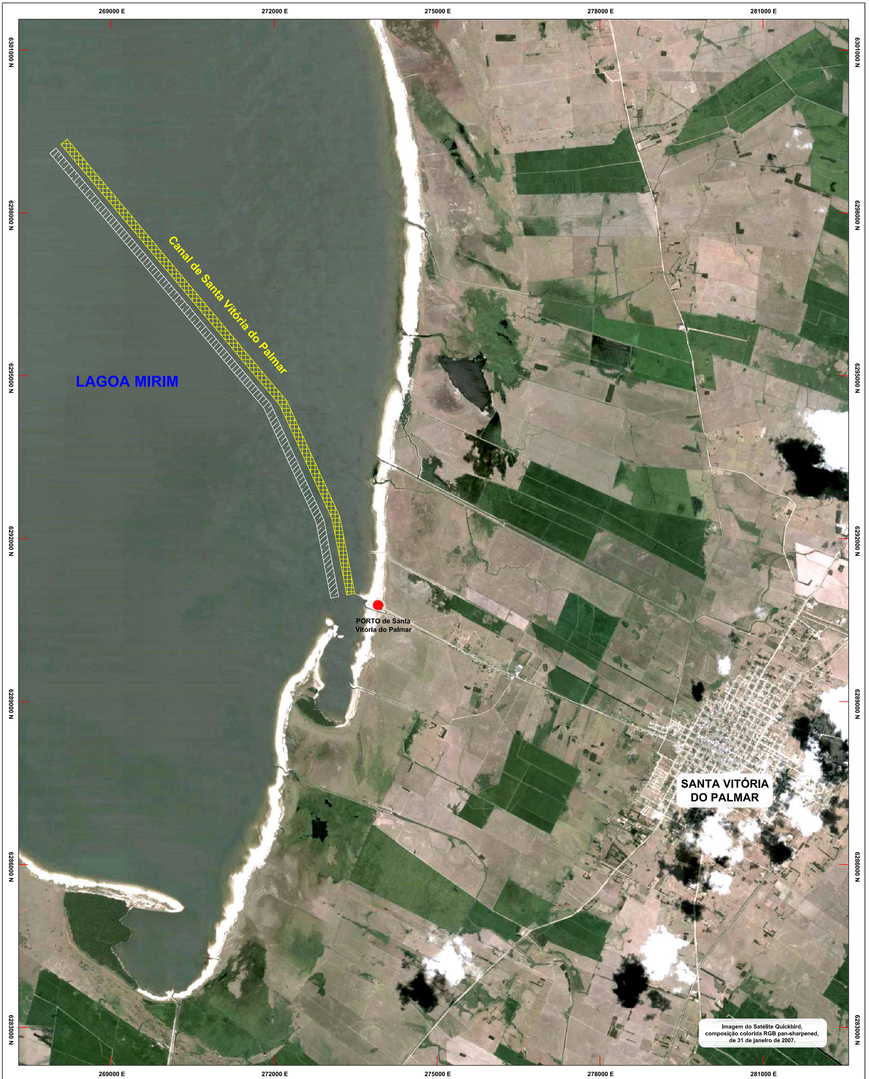
Imagem do Satélite Quickbird, composição colorida RGB pan-sharpened, de 31 de janeiro de 2007.